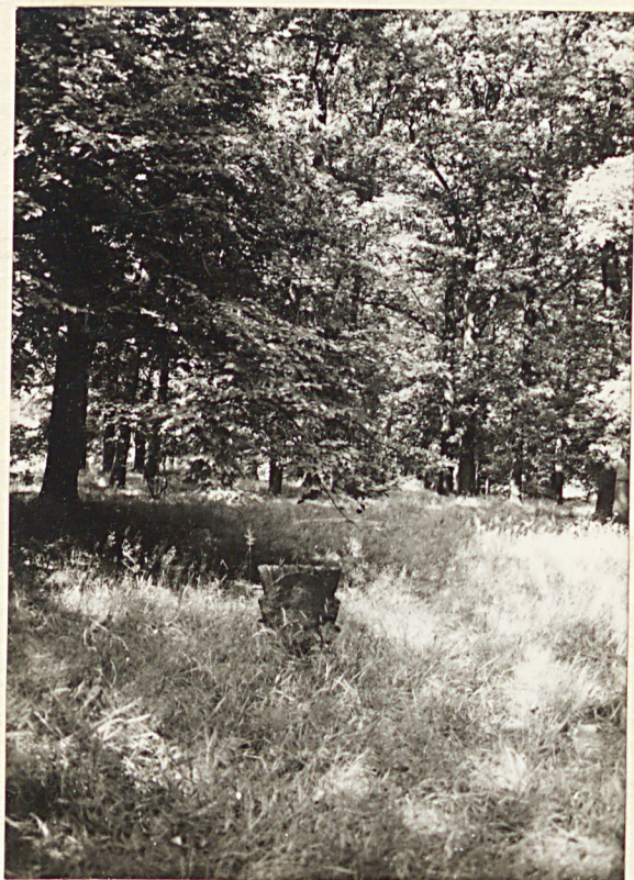
3. teren cmentarza z reliktdowo zachowanym nagrobkiem ewangelickim na pierwszym planie