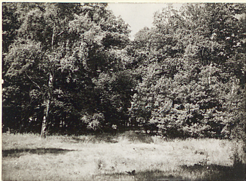
1. Widok ogólny terenu cmentarza w kierunku południowym