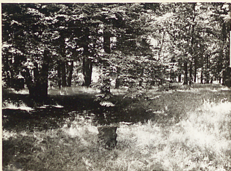
2. Widok terenu cmentarza w kierunku północnym