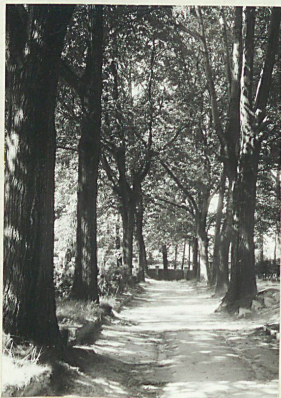
4. Aleja dębowa