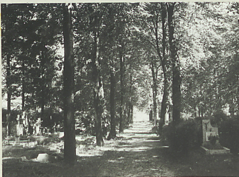
6. Aleja lipowa