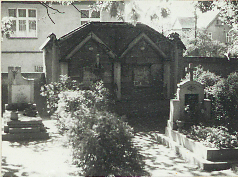
5. Nagrobek przyścienny