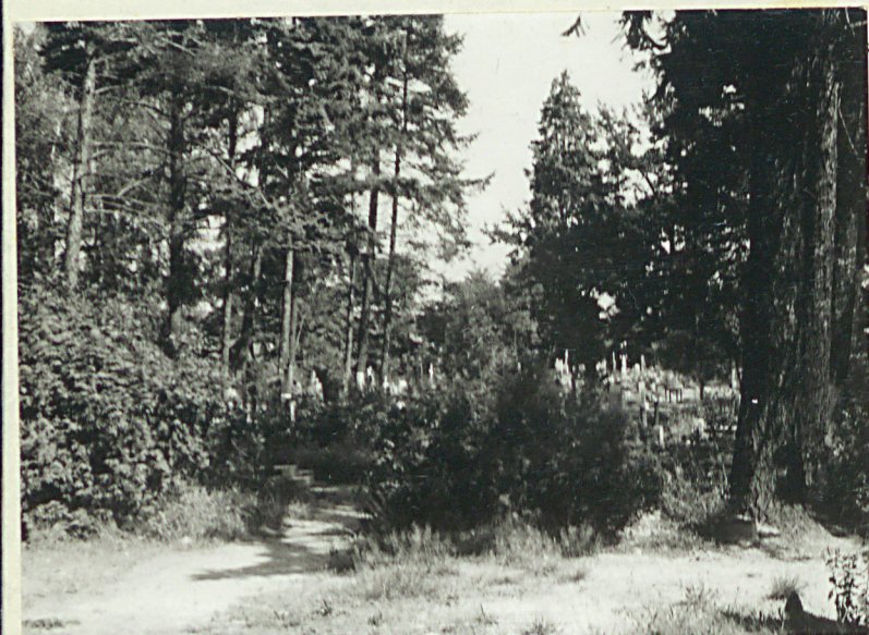
2. Górny poziom cmentarza