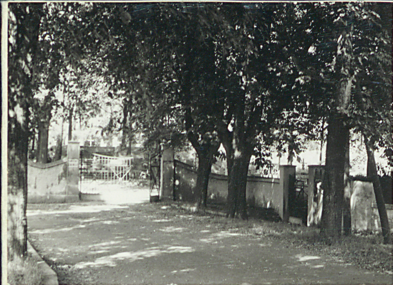
1. Widok ogólny