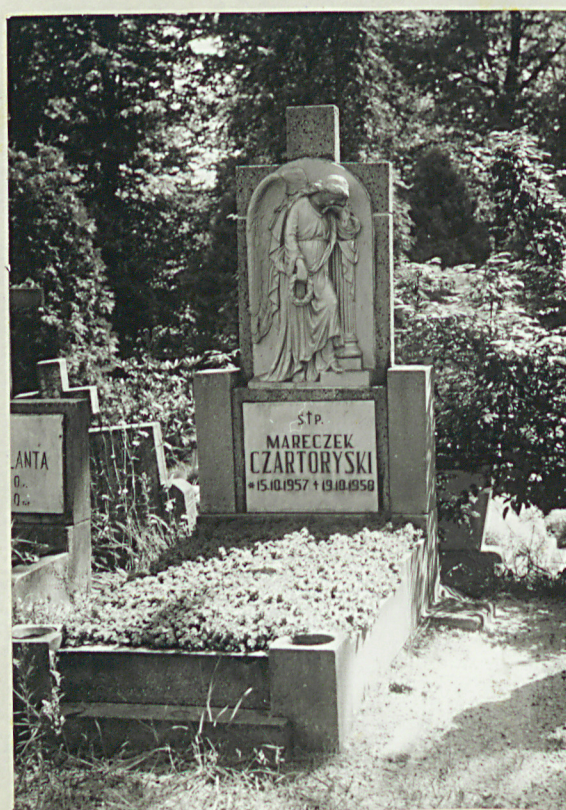
7. Nagrobek Marka Czartoryskiego/1958/