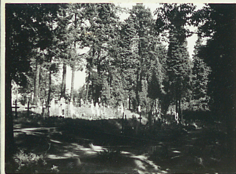
3. Stok południowy