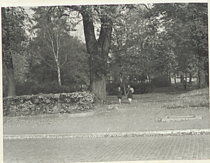
1. Widok ogólny terenu pocmentarnego / skwer /