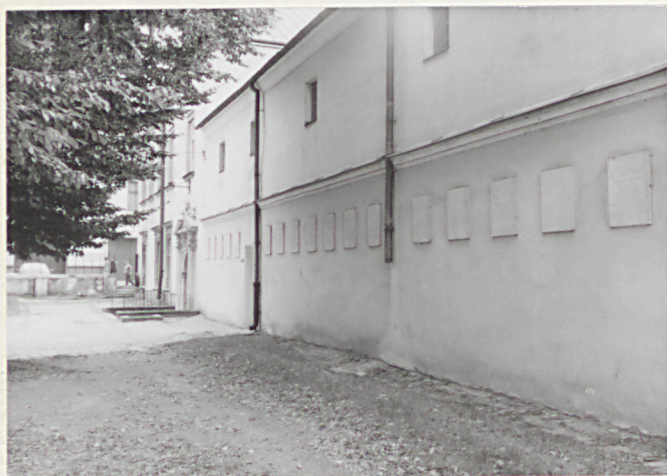
3. Pñ. część d.cmentarza