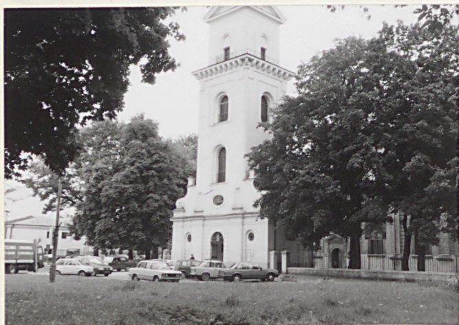
2. Widok na dzwonnice od pñ.