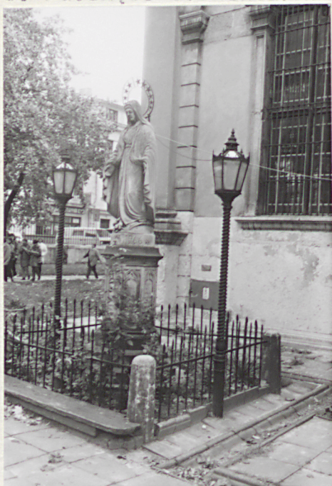
5. Figurka Matki Boskiej