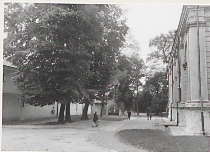
6. Pñ. część d.cmentarza