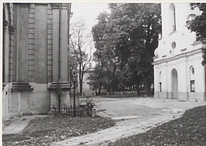
4. Pñ. część d.cmentarza