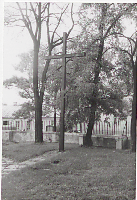
8. krzyż misyjny