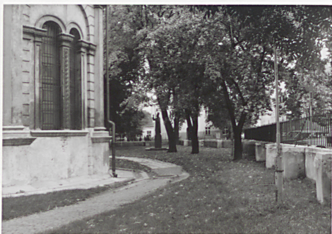
7. Widok na pn. część d. cmentarza