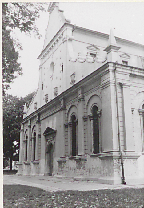
1. Elewacja frontowa kolegiat