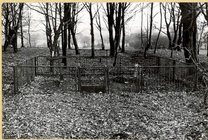
1. Widok cmentarza od strony drogi Grabowiec - Hrubieszów.