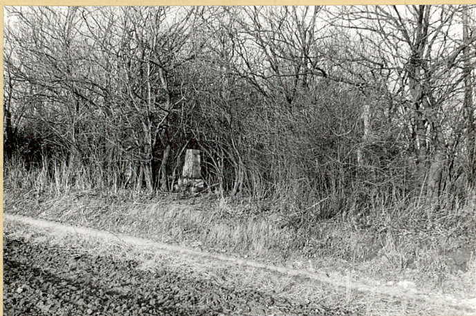
3. Widok cmentarza od strony południowo-zachodniej.