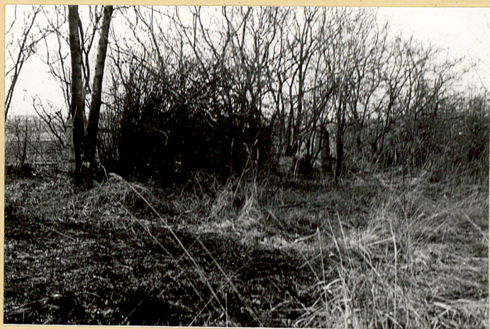
2. Widok "wnętrza" cmentarza od strony Południowo-wschodniej.