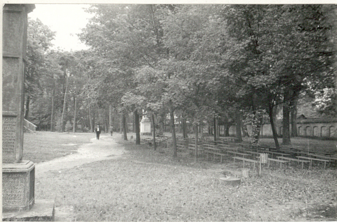
6. Pd. część d. cmentarza