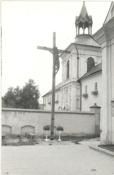
2. Krzyż misyjny