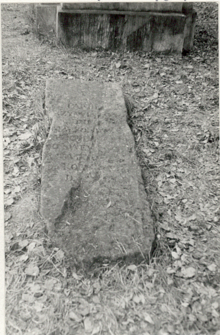
5. Jedyńy zachowany nagrobek z I poł. XIX w.