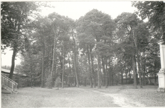
7. Płn. część d. cmentarza