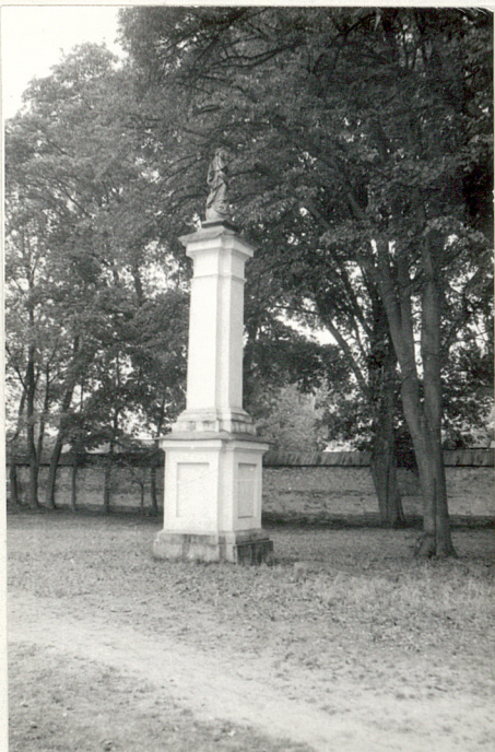
4. Późnobarokowa figurka Matki Boskiej