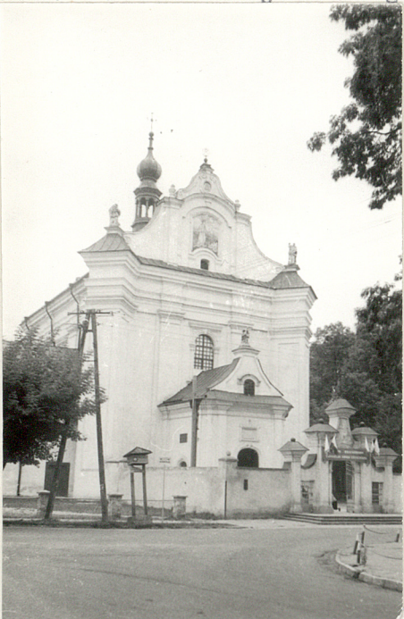
1. Elewacja front. kościoła