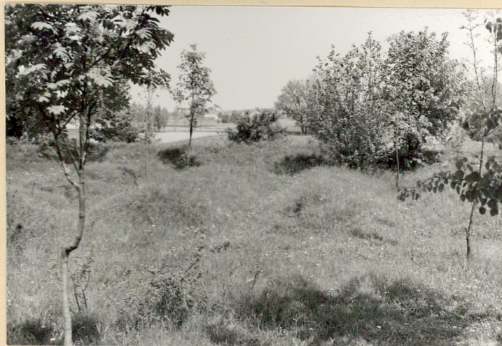
3. Mogiły zbiorowe.