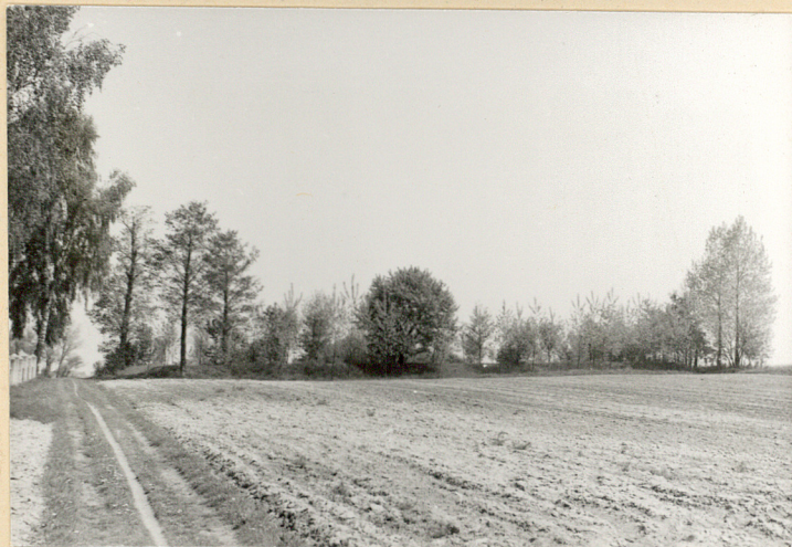
1. Widok cmentarza od strony Kitowa