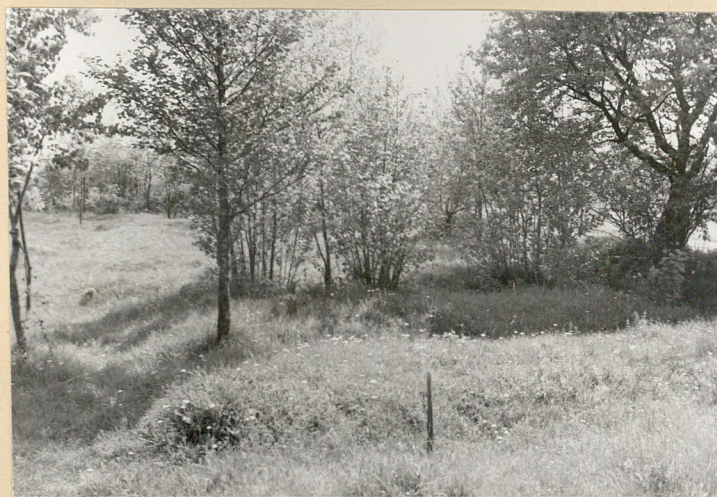
2. Widok ogólny