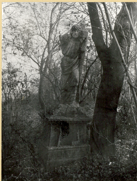
4. Nagrobek - Aurelia Piłat + 5 marca 1919r.