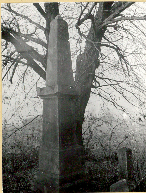
1. Nagrobek - Florian Tor + 25 listopada 1918r.