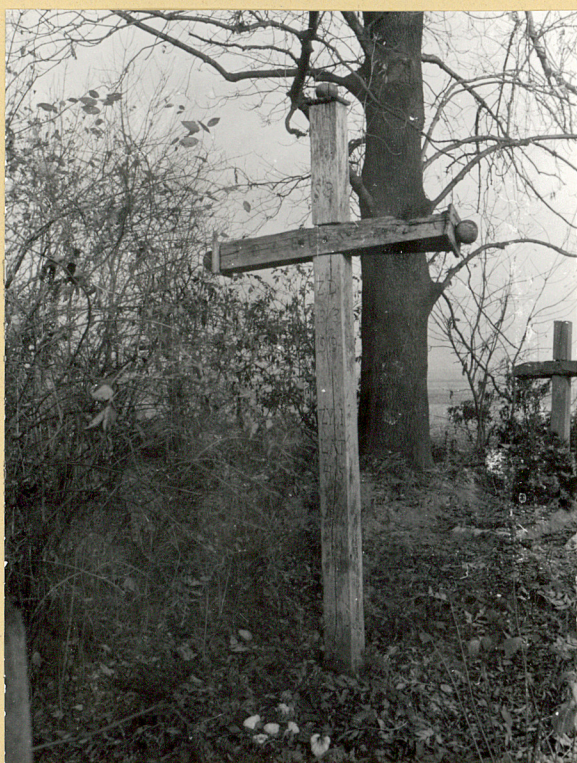
3. Mogiła z krzyżem drewn. Józef Szarca + 13 marca 1919r.