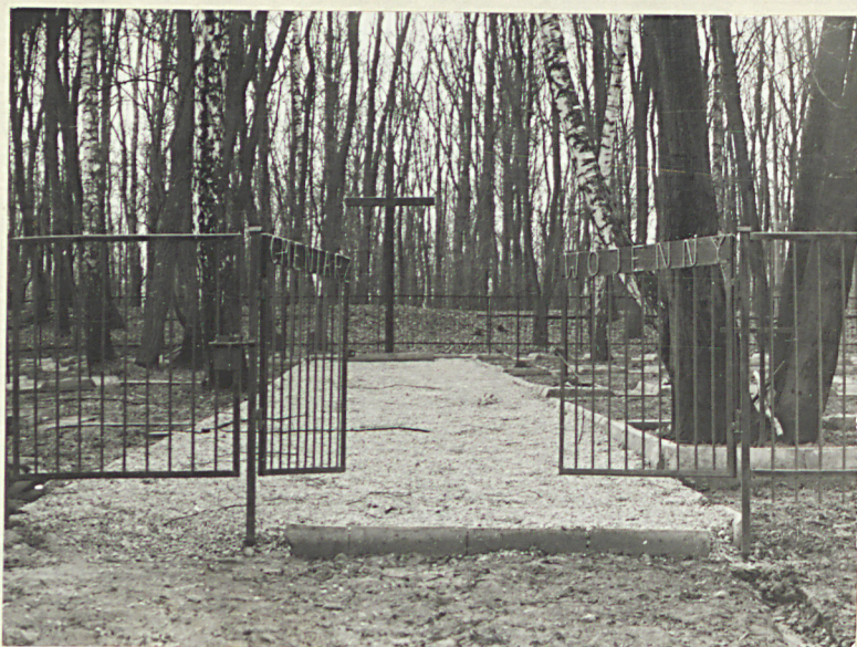
FOT.1. GŁÓWNE WEJŚCIE W CZĘŚCI PN. CMENTARZA