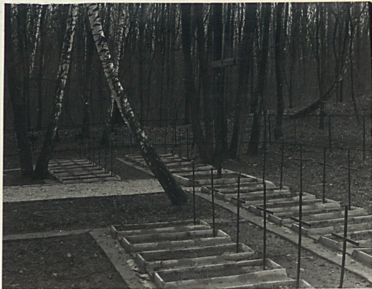
FOT.3 WIDOK OGÓLNY OD STR. ZACH.