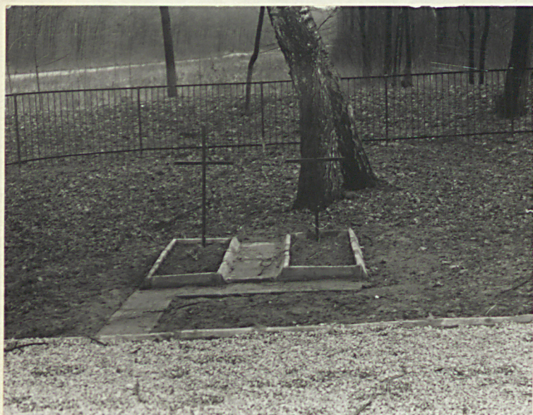
FOT.2 MOGIŁY W CZ. WSCH. CMENTARZA