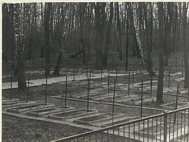
FOT.4. WIDOK CZĘŚCI PD. CMENTARZA