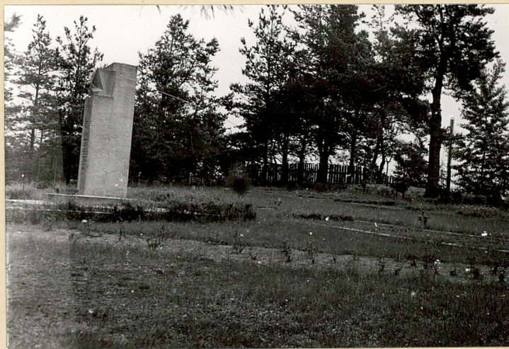
2. Mogiły zbiorowe