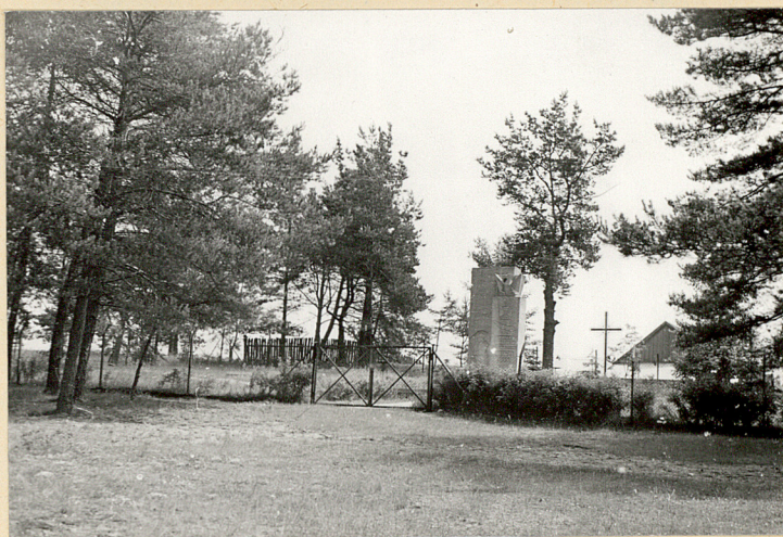
4. Widok od strony szosy.