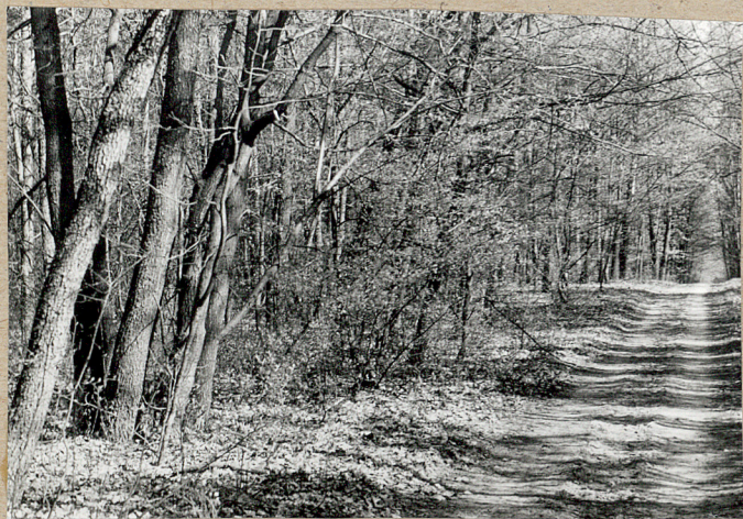
1. Droga leśna od szosy do mogił.