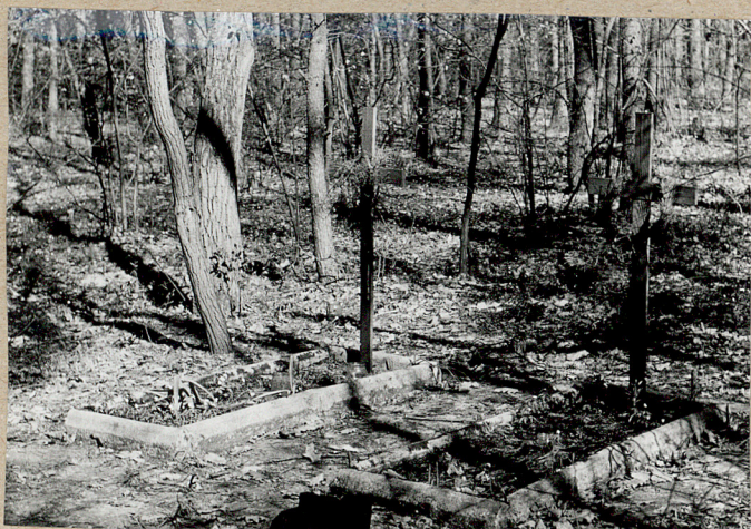
2. Dwie mogiły odnowione