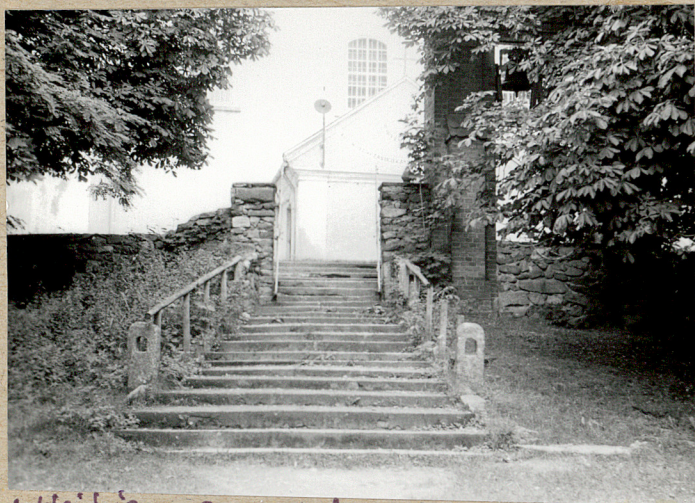
1. Wejście na cmentarz.