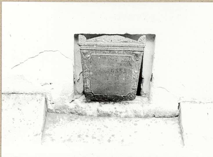
6. Blacha trumienne zakrywająca okienko piwniczne kościoła.