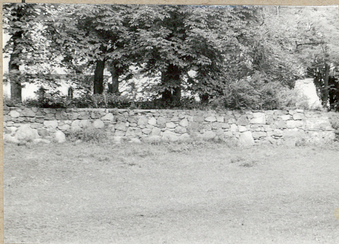
5. Zachodnia część cmentarza