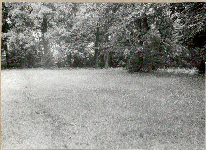
3. Południowa część cmentarza