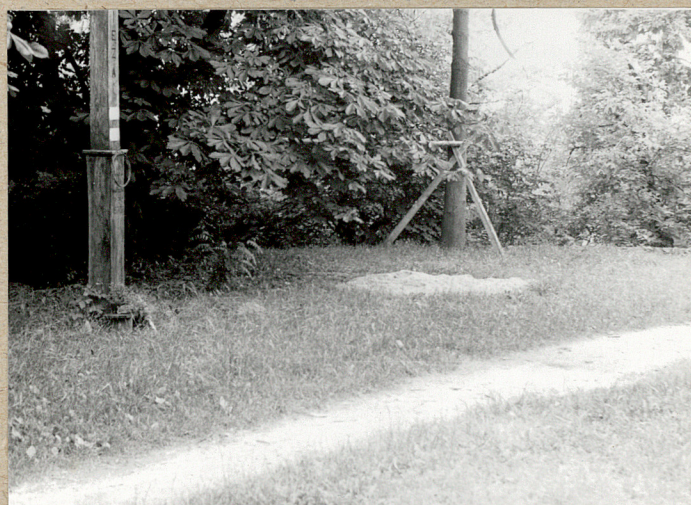
4. Wschodnia część cmentarza