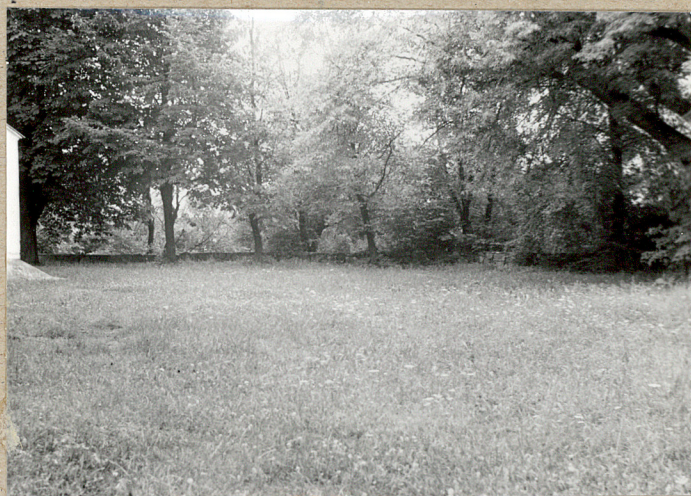
2. Północna część cmentarza