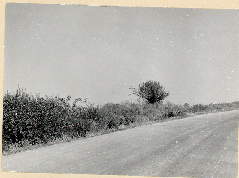
2. Niedziałowice, gm. Rejowiec. Cmentarz wojenny. Widok ogólny. Fot. Cz. Kiełboń 1985. Neg. BBiDZ-Chełm.