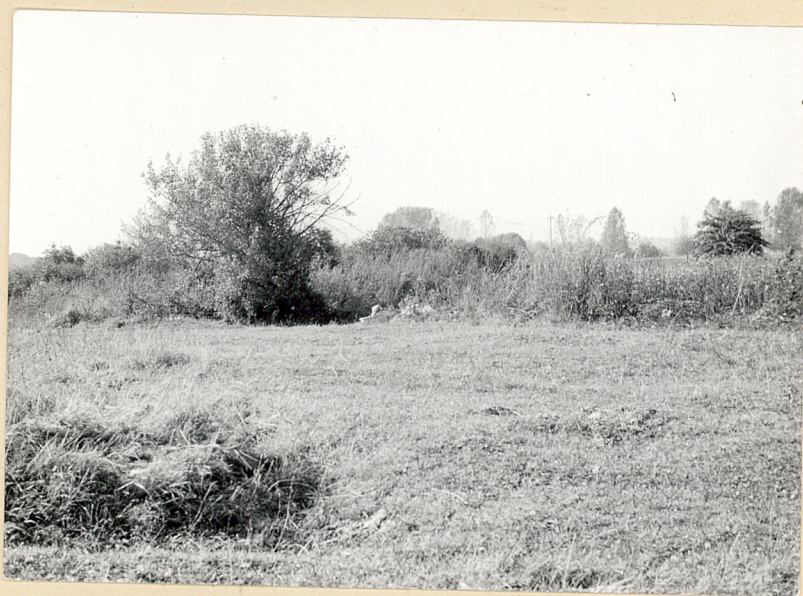
3. Niedziałowice, gm. Rejowiec. Cmentarz wojenny. Fot. Cz. Kiełboń, 1985. Neg. BBiDZ-Chełm.