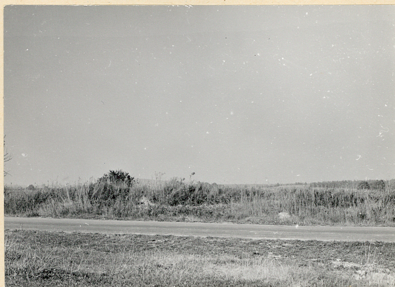
1. Nie sziałowice, gm. Rejowiec. Cmentarz wojenny. Widok ogólny. Fot. Cz. Kiełboń 1985. Neg. BBiDZ-Chełm.