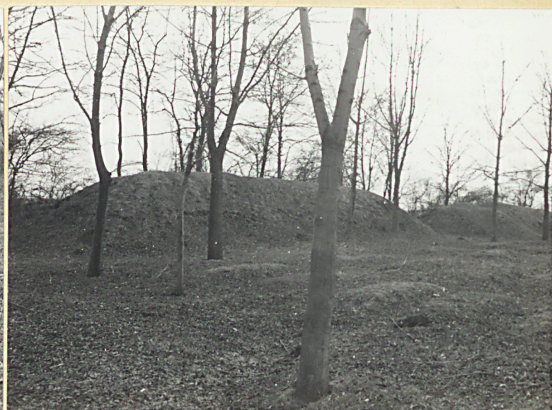
2. Zdjęcie widokowe