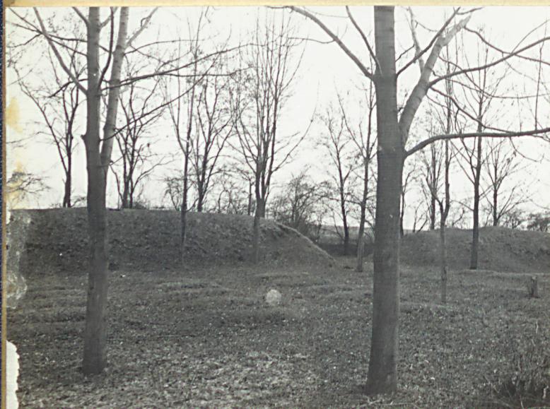
3. Zdjęcie widokowe