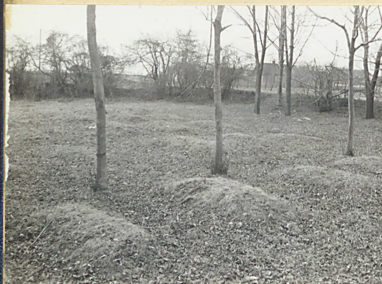
1. Zdjęcie widokowe