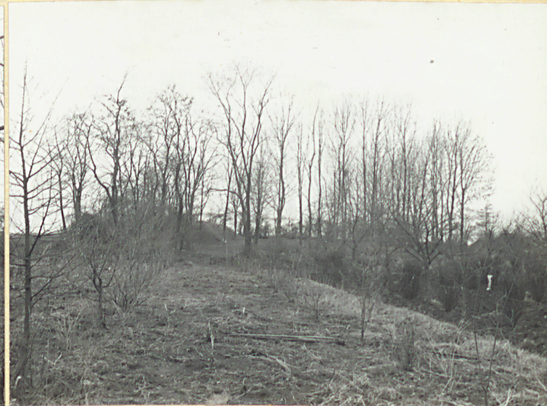
4. Zdjęcie widokowe