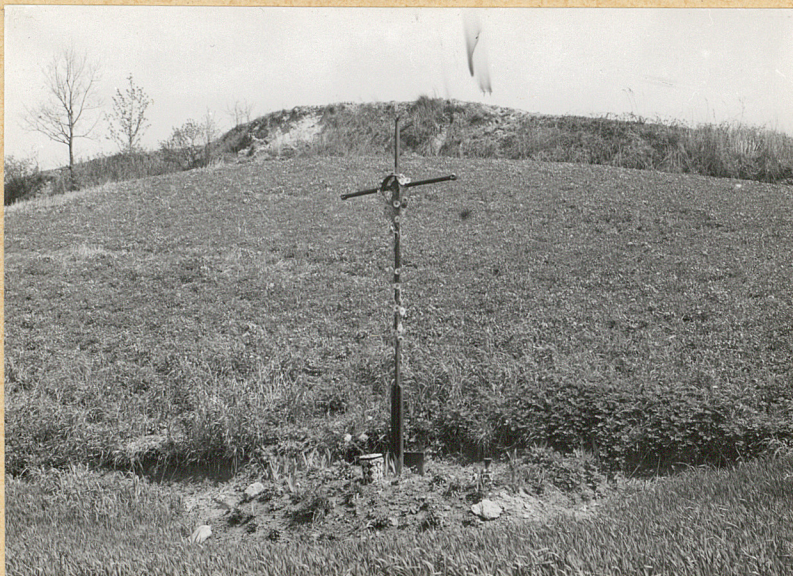
1. Widok mogiły.