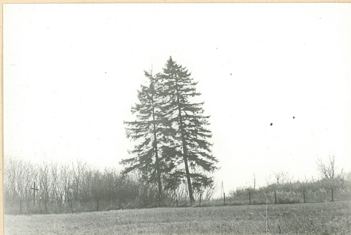
5. Widok ogólny od str. wsi.