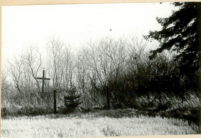
4. Widok ogólny