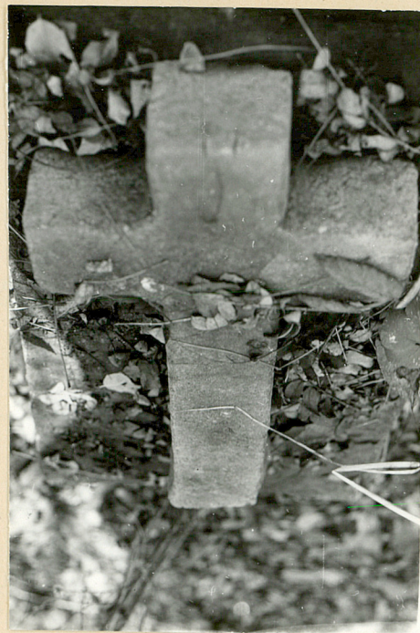
3. Nagrobek kamienny k. XIX w.