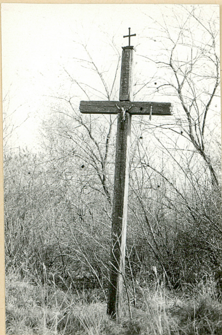
1. Mogiła z krzyżem drewn.