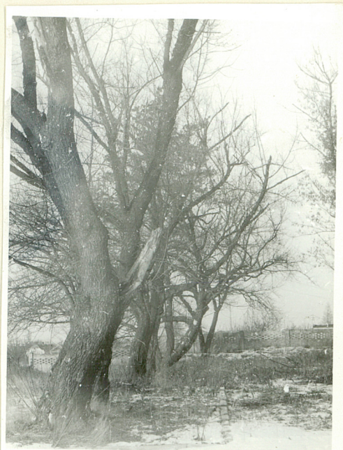
Drzewostan alei bocznej kwatery żołnierzy niemieckich /stan z 1984r/