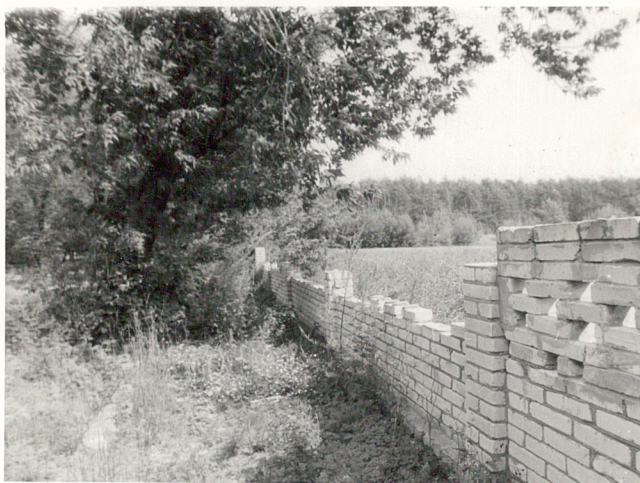
IV. Ogrodzenie cmentarza od str. pld.