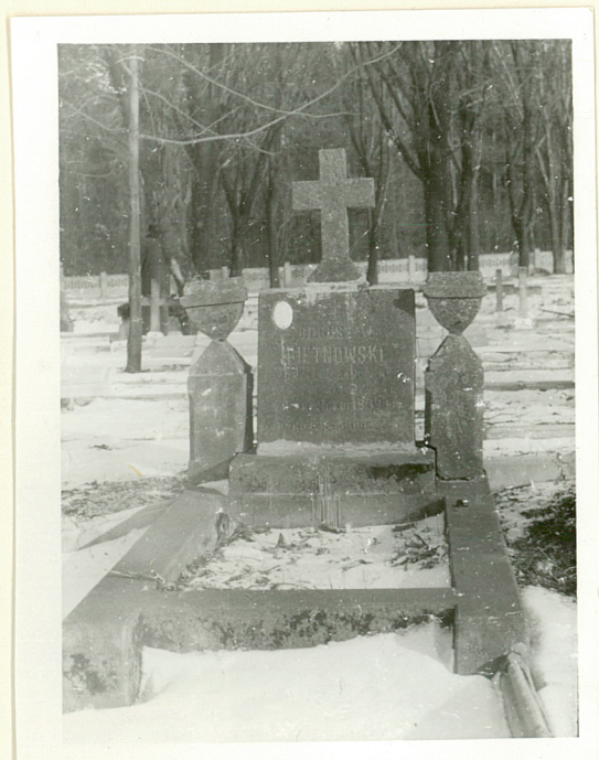
Mogiła Bogusława Pietnowskiego, zm. 1929r