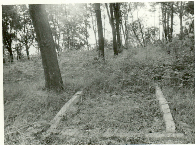
Ślady alei..... ?