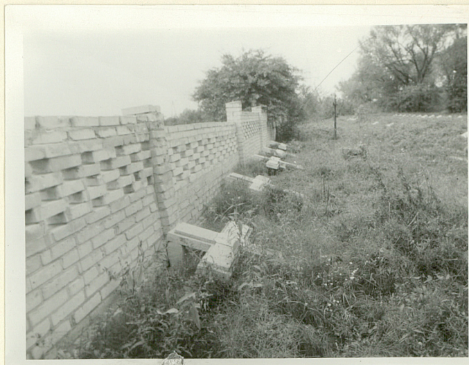
VIII. Widok na kwaterę żołnierzy polskich od str. pld./ogrodzenie cm.od str. zach./