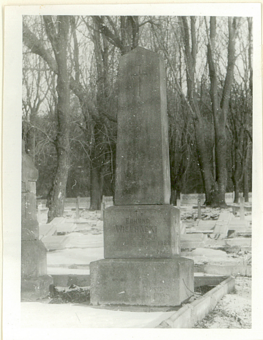
Nagrobek Edmunda Wielbackiego, zm. 1929r