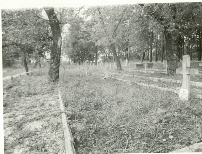
Kwaterna żołnierzy polskich z okresu I i II wojny światowej a/ stan z roku 1984 b/ stan z roku 1986