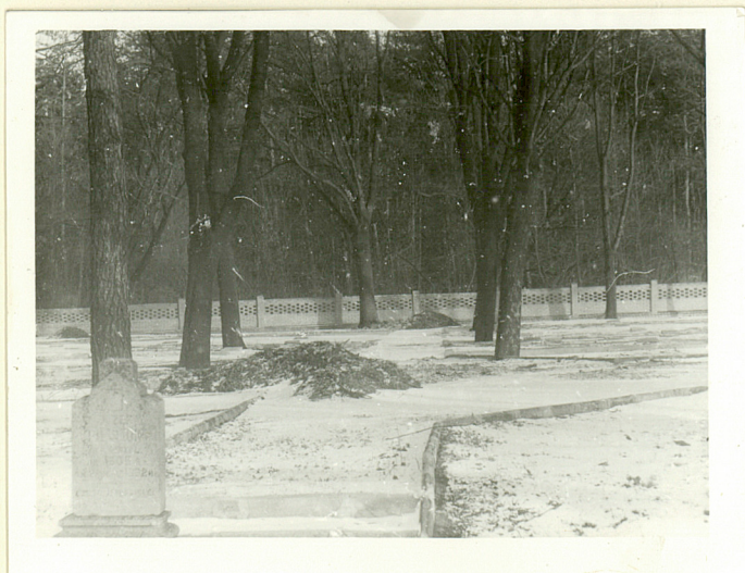
VI. Kwaterna żołnierzy radzieckich od str. zach.-stan z roku 1984