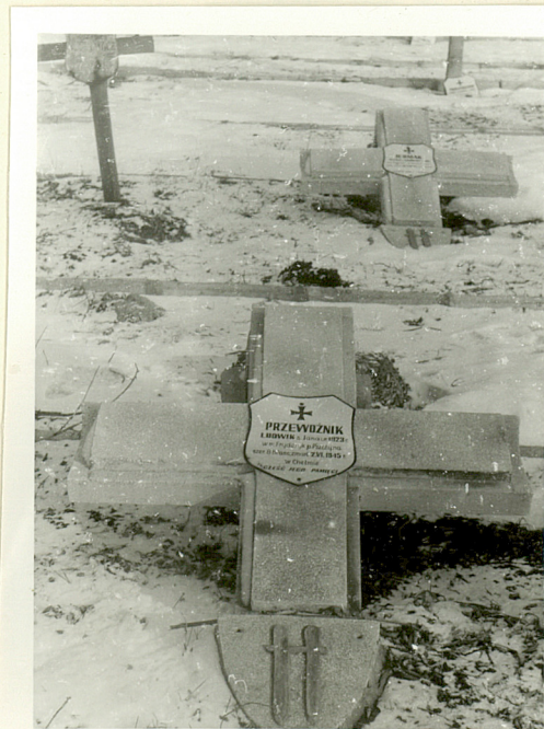
Mogiła Ludwika Przewoźnika,1945r