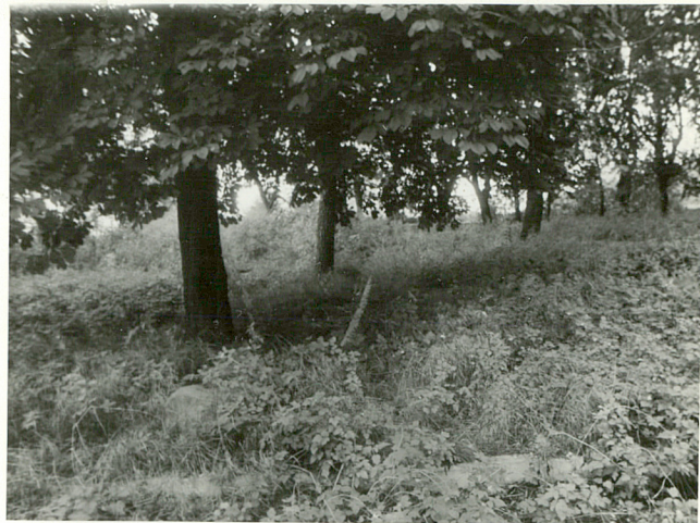
Aleja boczna kasztanowa kwatery żołnierzy niemieckich - 1986r