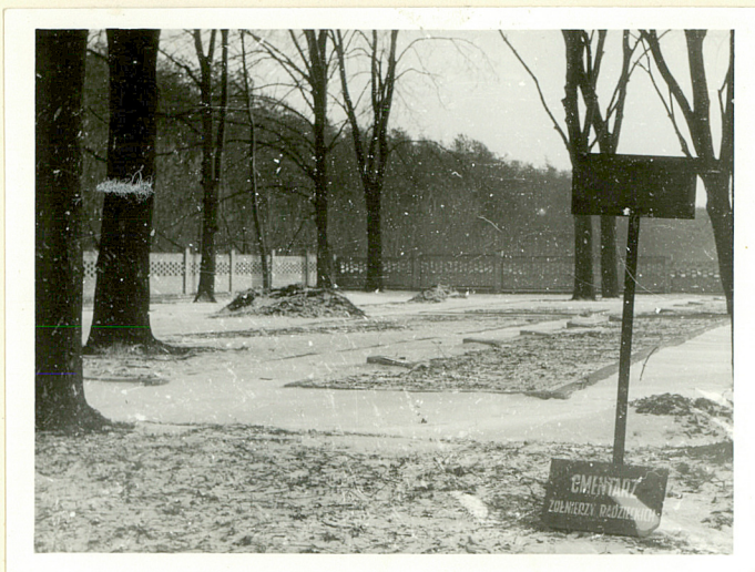
V. Widok na kwaterę cm .żołnierzy radzieckich od str. płu /od alei głównej i bramy - stan z roku 1984.