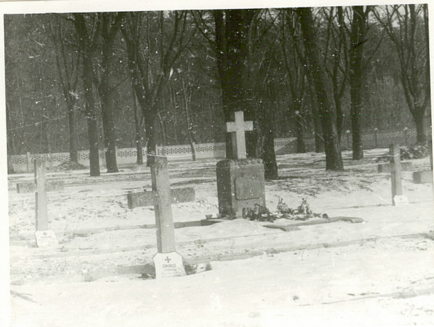
Widok na kwaterę żołnierzy radz. od str. zach.