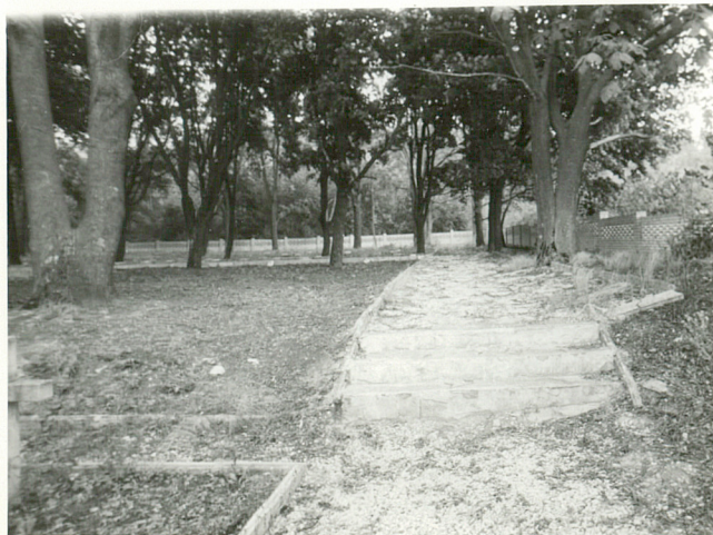
Aleja boczna cmentarza /str.płd/