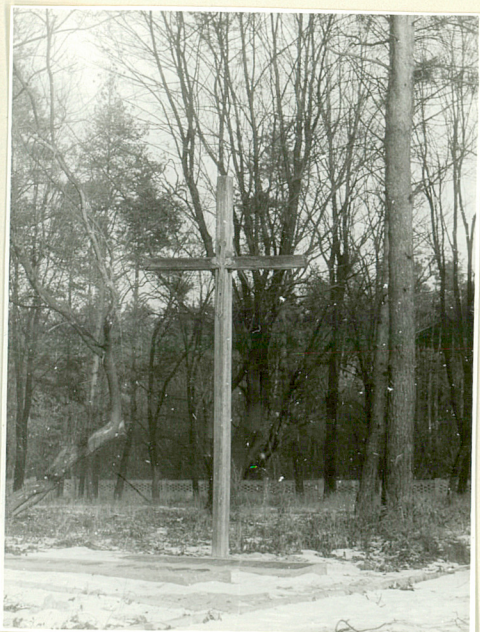
Krzyż drewniany wzniesiony w 1984r na kwaterze żołnierzy niemieckich /stan z r.1986/