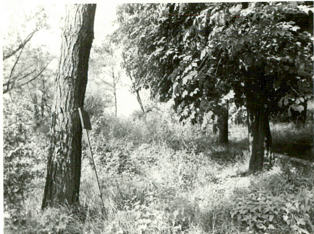
Tablica ,niegdys pełniąca funkcję informacyjną..... - 1986r