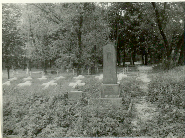
IX. Ogólny widok na kwaterę żołnierzy polskich od str. zach.