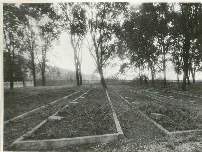
Widok na mogiły na kwaterze żołnierzy radzieckich a/ stan z roku 1984 b/ stan z roku 1986