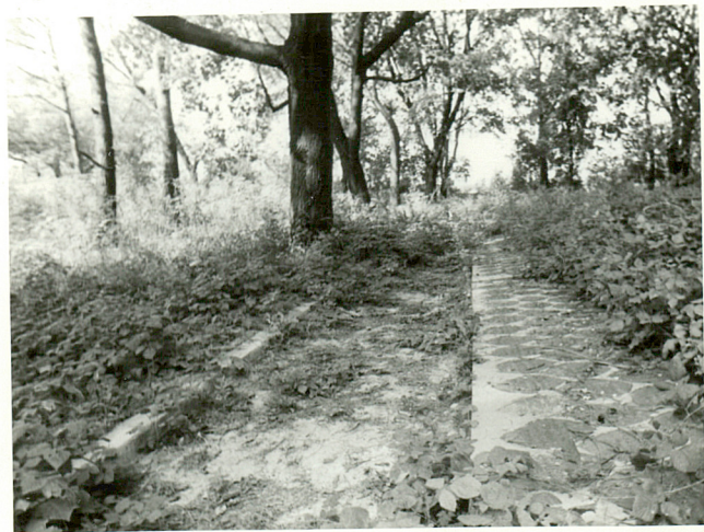
Tablice z krzyży żeliwnych przed 1984r znajdujących się na cm. przy ul.Grottgera w Chełmie.