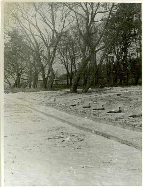
Widok na kwaterę żołnierzy niemieckich od str. pld. /stan z 1984r/