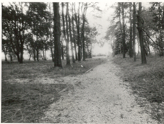
III. Aleja główna cmentarza /fot.od str. wsch ku zach/