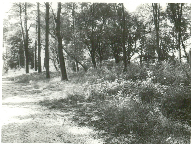
X. Widok ogólny kwatery żołnierzy niemieckich od str. wsch.