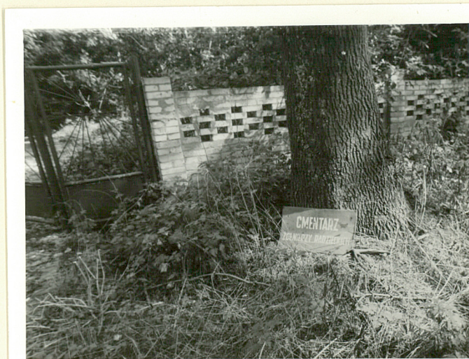
Tablica informująca o kwaterze żołnierzy radzieckich zmieniła znacznie swoje położenie - stan z roku 1986