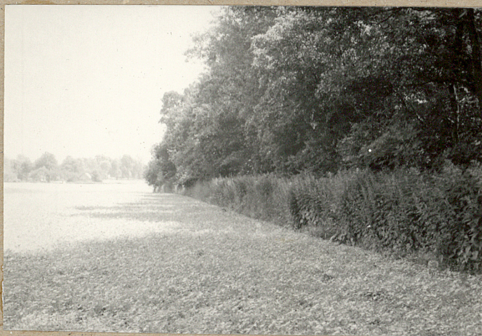
3. Granica cmentarza od północy.