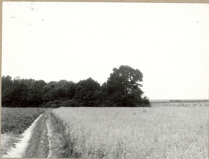
1. Widok cmentarza od strony szosy