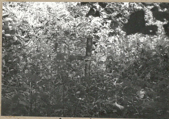
2. Krzyż wśród zarośli.