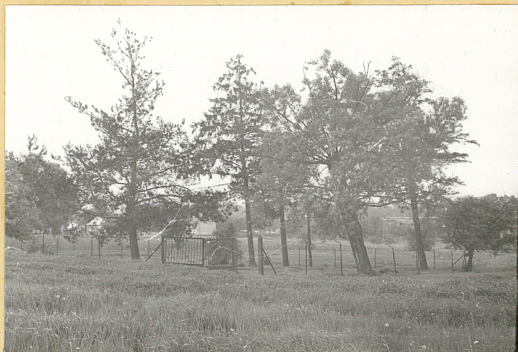
2. Strona północna