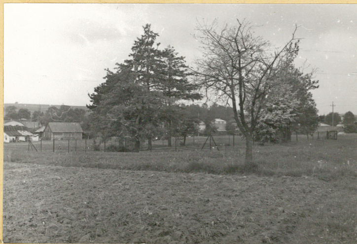
3. Strona północno-wschodnia