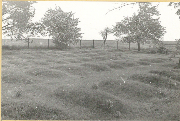
1. Kwatery żołnierskie