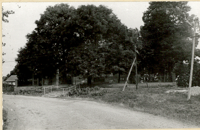
2. Cmentarz od południa