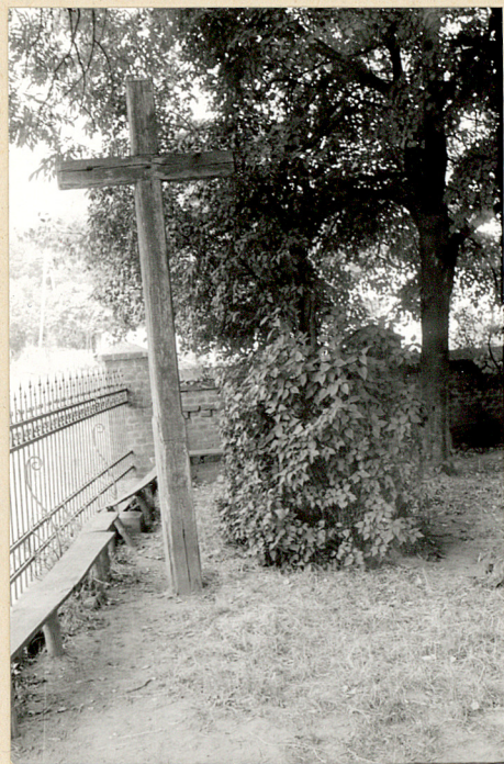
10. Krzyż misyjny z 21-29.IX. 1935r.