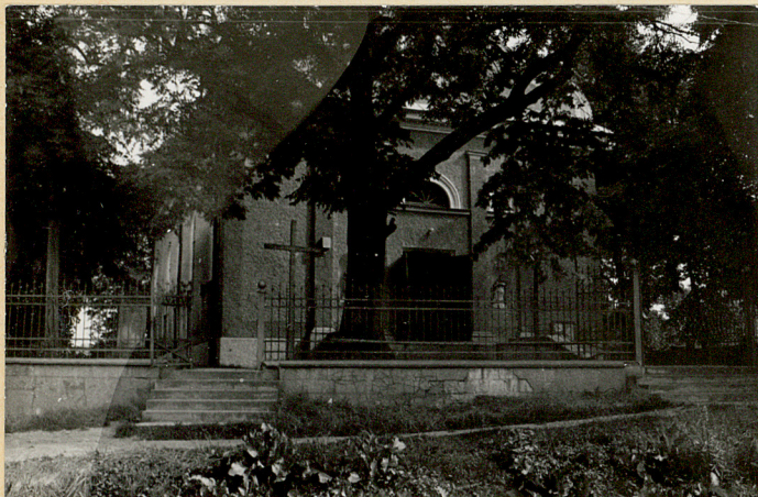
3. Kościół od południa