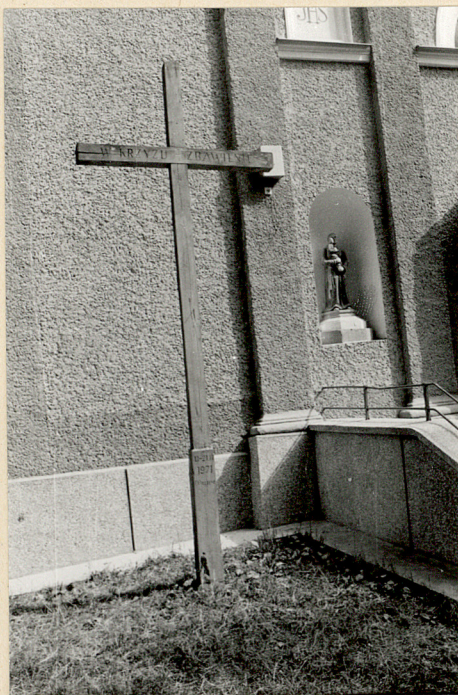
11. Krzyż misyjny z 13-21.III. 1971r.