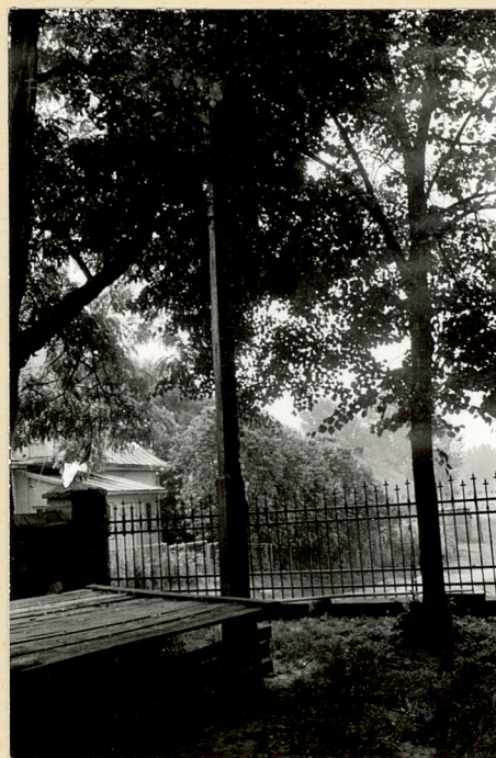
4. Krzyż misyjny z 24-31.V.1981r.