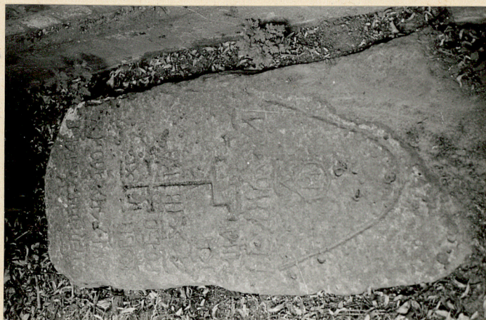
13. Płyta nagrobna Michała Kownrowo XIXw.?