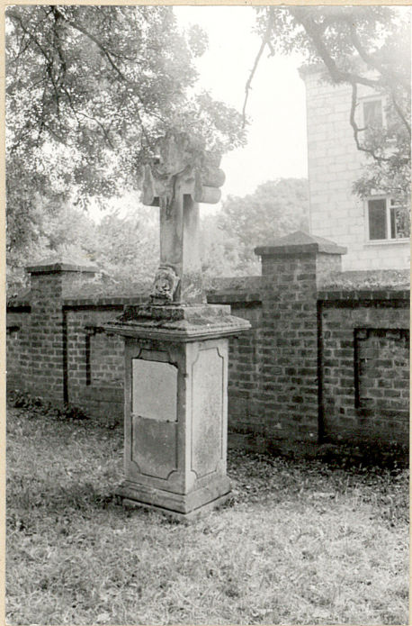
5. Nagrobek kamienny Wojciecha Chłopeckiego +1847r.