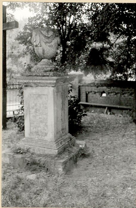
9. Nagrobek kamienny klasycystyczny Józefa Lityńskiego +1801r.