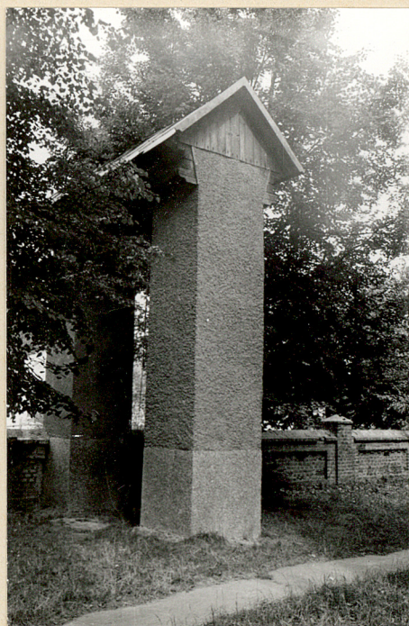
8. Dzwonnica murowana poł.XIXw.