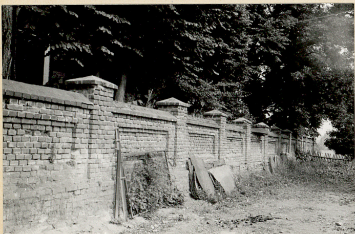
12. Mur cmentarny od wschodu z cegły XIXw.