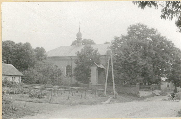
1. Kościół i cmentarz od zachodu