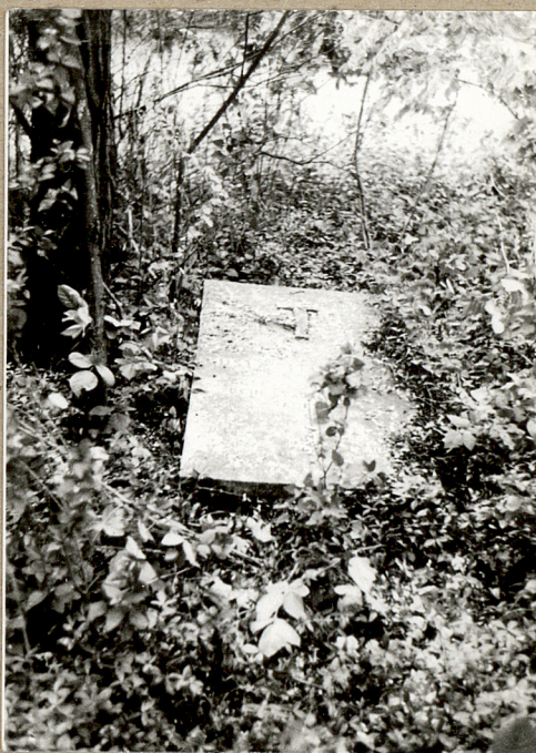
5. Jedna z najstarszych płyt