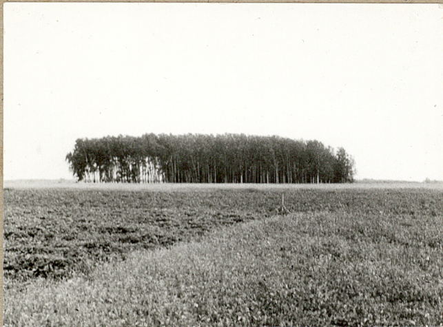
1. Widok cmentarza od strony pól