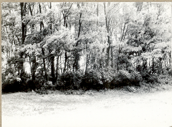
3. Tylna część cmentarza