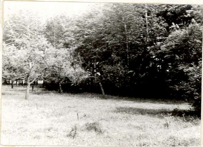
6. Widok cmentarza od strony północnej