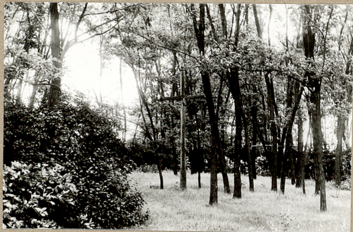
4. Widok ze środkowej części cmentarza z knykiem