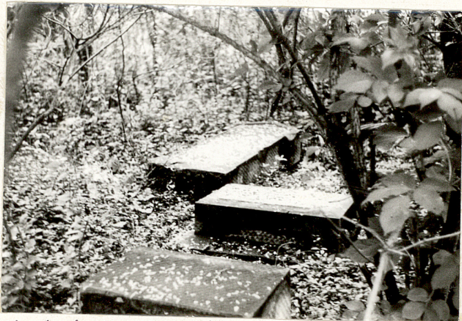
7. Zwalone nagrobki w środkowej części cmentarza.