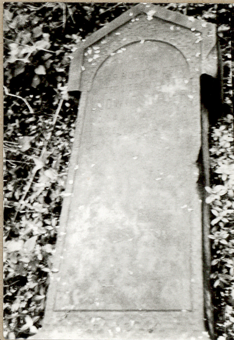
2. Jeden z najstarszych nagrobków