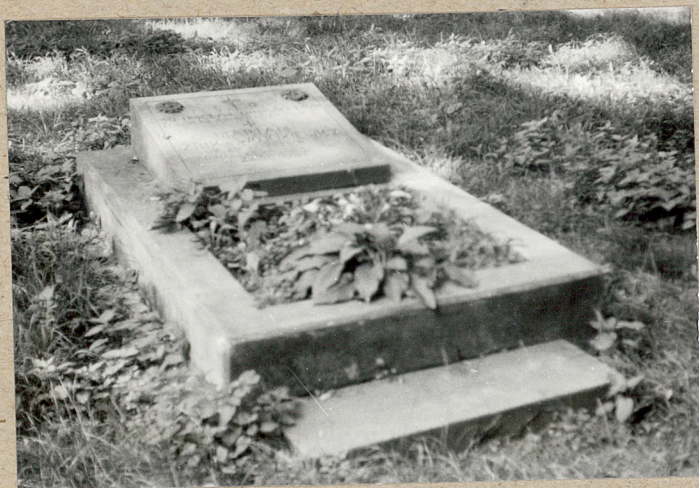
magrobel z 1944 r. od strony pół. kościoła