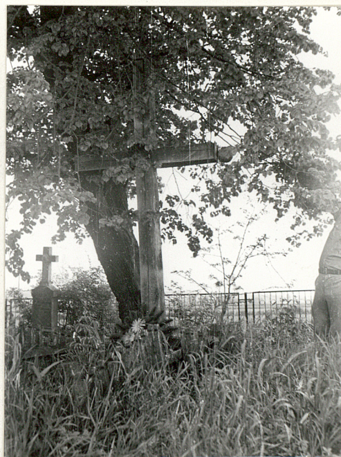
8. Krzyż drewniany z I poł. XX w. - inskrpcji brak.