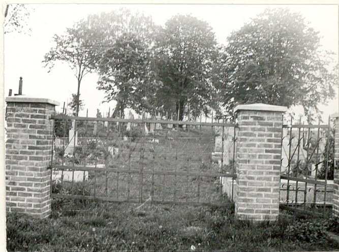
12. Widok cmentarza ze strony południowej.