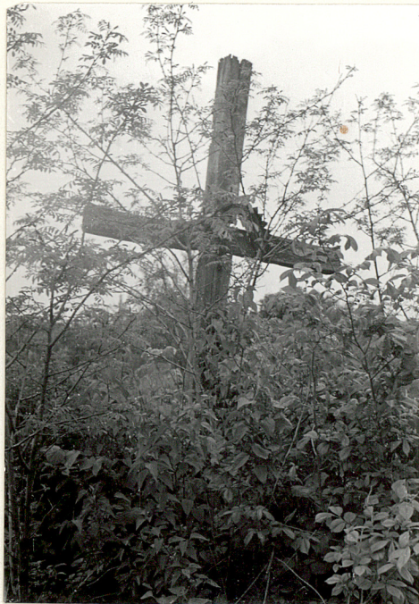
10. Krzyż drewniany w części prawosławnej, prawdopodobnie z I poł. XX w.