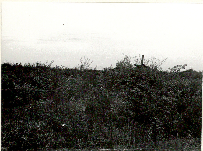
11. Widok cmentarza ze strony wschodniej/część prawosł./