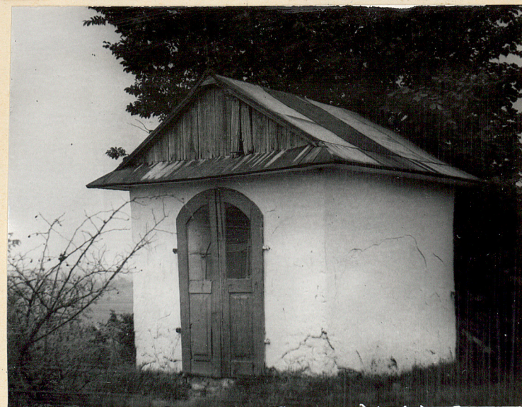
2. Zastawie, gm. Goraj. Cmentarz z I wojny światowej. Kapliczka cmentarna. Widok od strony pld. Fot. Cz. Kiełboń, 1985. Neg. BBIDZ-Zamość.