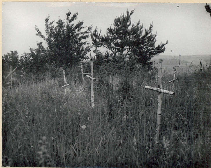
4. Zastawie, gm. Goraj. Cmentarz z I wojny. Fragment części płu. Fot. Cz. Kiełboń, 1985. Neg. BBiDZ-Zamość.