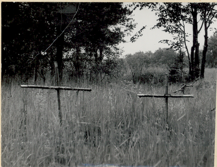
5. Zastawie, gm. Goraj. Cmentarz z I wojny. Fragment cz. wschodniej. Fot. Cz. Kiełboń, 1985. Neg. BBiDZ-Zamość.