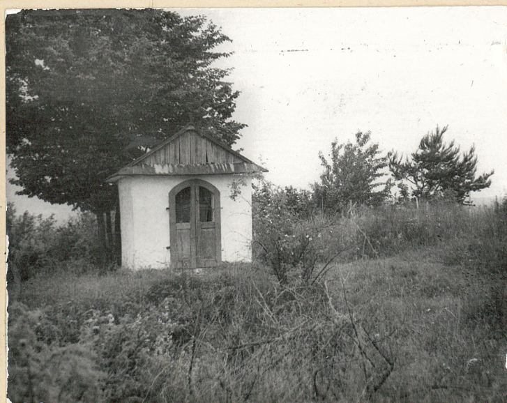
1. Zastawie, gm. Goraj. Cmentarz z I wojny światowej. Widok ogólny od str. pld. na cmentarz i kapliczkę. Fot. Cz. Kiełboń, 1985. Neg. BBIDZ-Zamość.