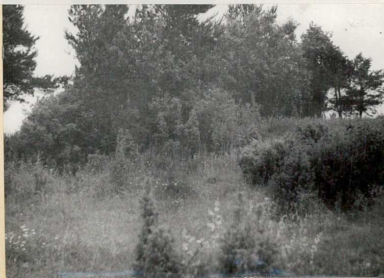
7. Zastawie, gm. Goraj. Cmentarz z I wojny światowej. Widok ogólny od pld. na cz. wsch. Fot. Cz. Kiełboń, 1985. Neg. BBiDZ-jw.