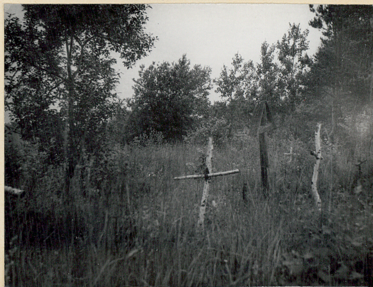
6. Zastawie, gm. Goraj. Cmentarz z I wojny. Fragment cz. środkowej. Fot. Cz. Kiełboń, 1985. Neg. BBiDZ-Zamość.