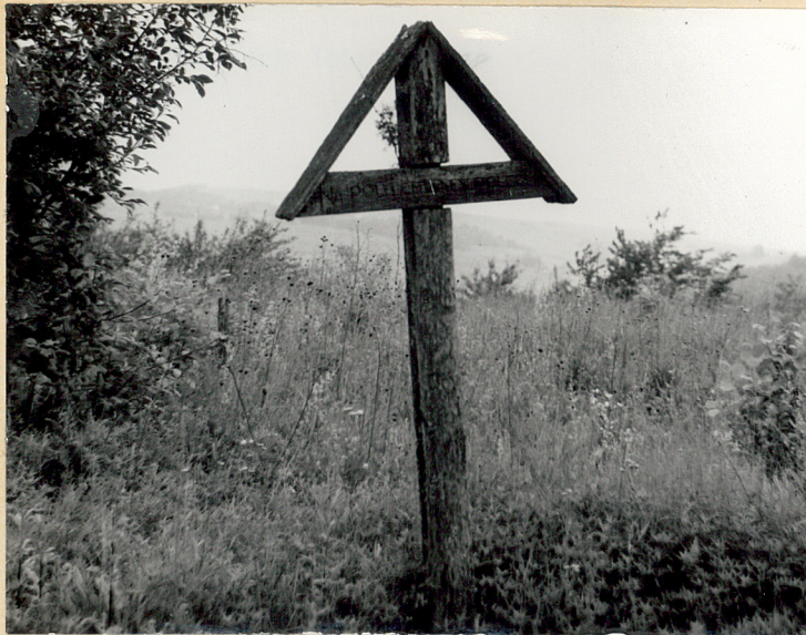
3. Zastawie, gm. Goraj. Cmentarz z I wojny. Drewniany krzyż cmentarny. Na krzyżu napis: "Na polu chwały polegli" 1985.