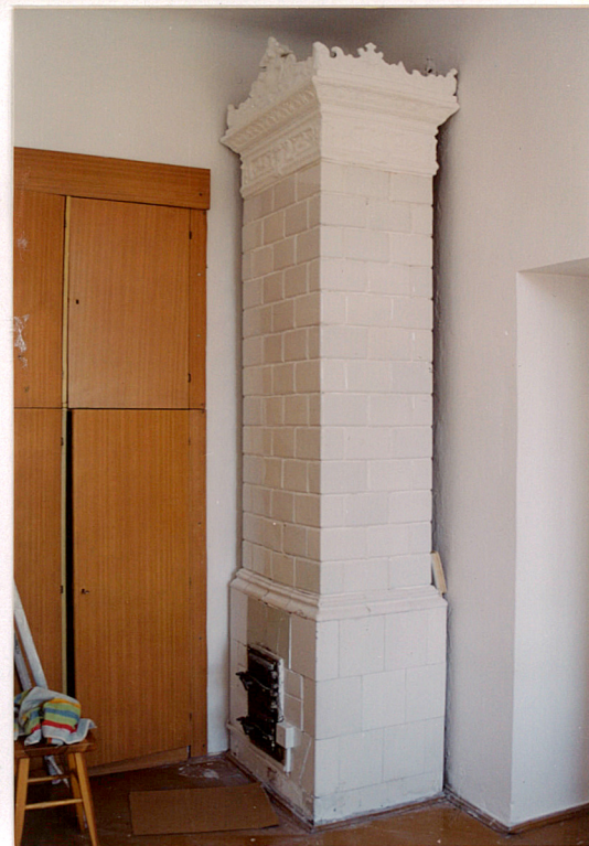
Piec w pomieszczeniu traktu frontowego na III p.