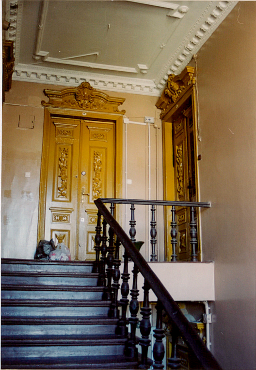
Wnętrze klatki schodowej.