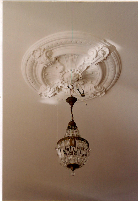
Rozeta sztukateryjna na suficie (lokal nr 9).