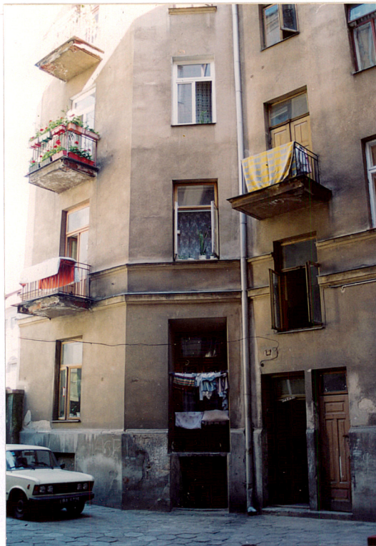
Fragment elewacji podwórzowej