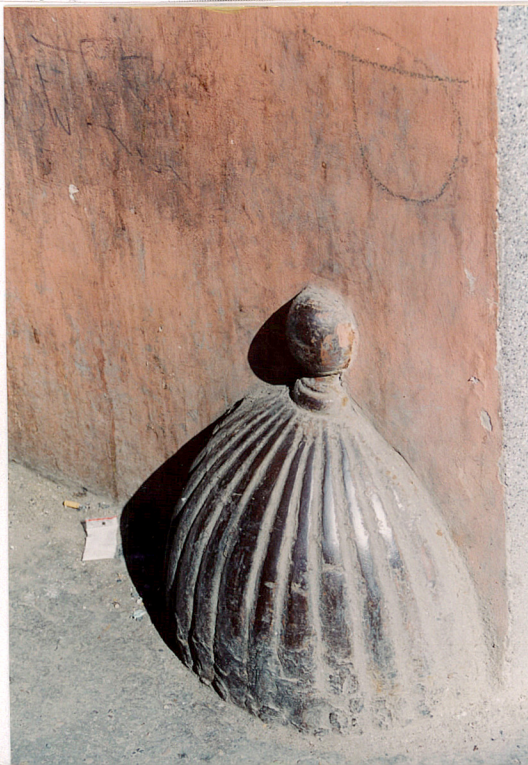
Żeliwny odbój w bramie.