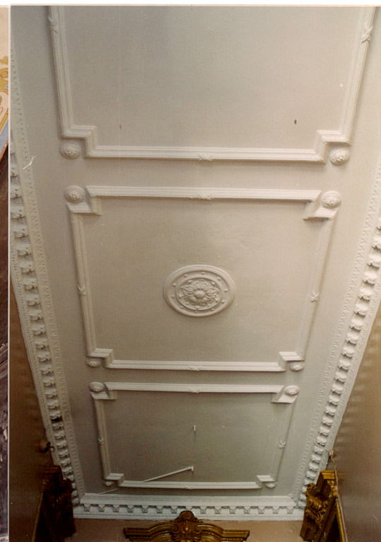
Faseta w podniebiu klatki schodowej.

Wkładkę założył: Jadwiga Teodorowicz-Czerepińska; 06.2004 (imię, nazwisko, data)