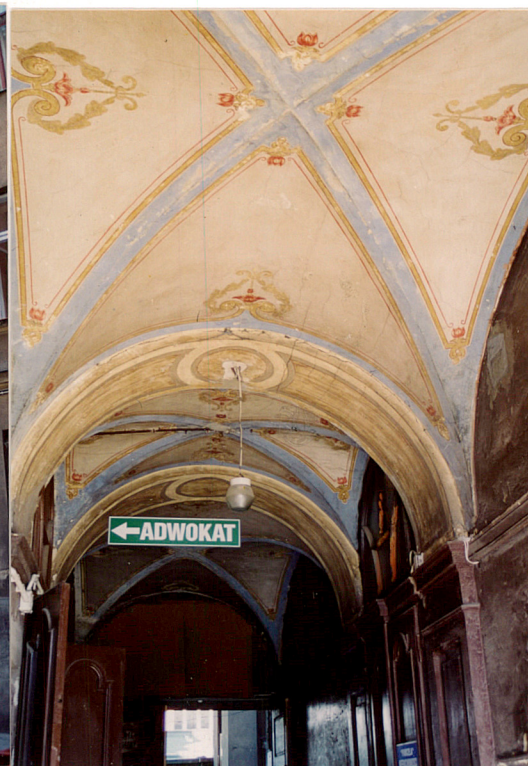
Wnętrze przejazdu bramnego.