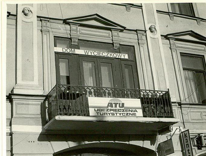
balkon w elewacji front.