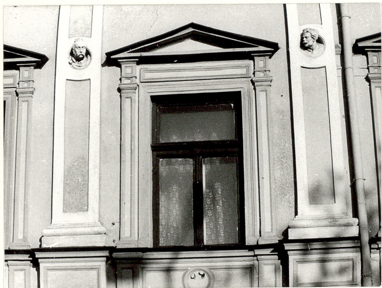
okno II kondygnacji