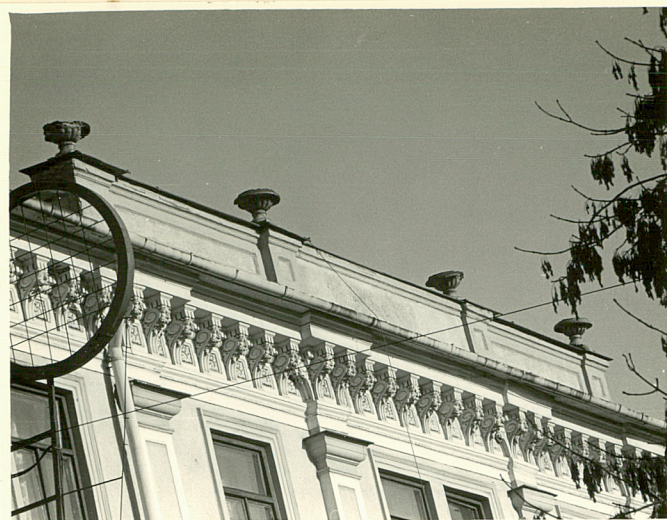
mur attykowy w elewacji front.