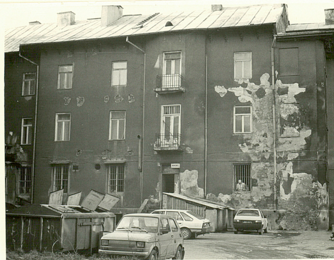
elewacja wsch. oficyny