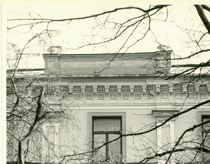
attykowy mur w elewacji zach.