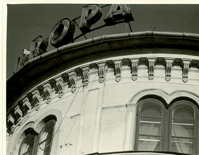
fryz konsolowy belwederu