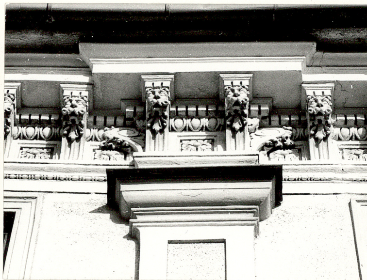
fragm.gzymsu elewacji front.