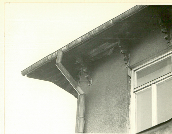
kroksztyny oficyny wsch.