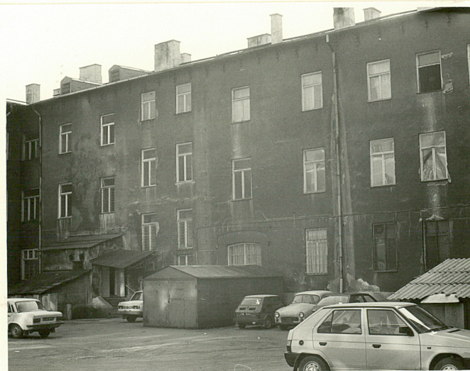
elewacja pñn.korpusu głównego