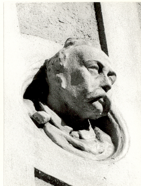
fragm.dekoracji elewacji front.