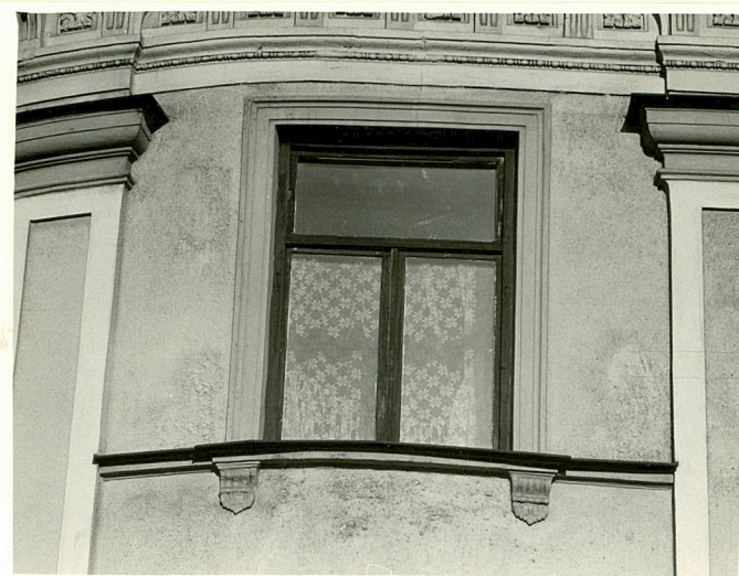
okno III kondygnacji