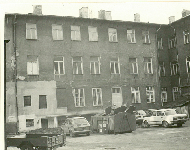
elewacja zach. oficyny