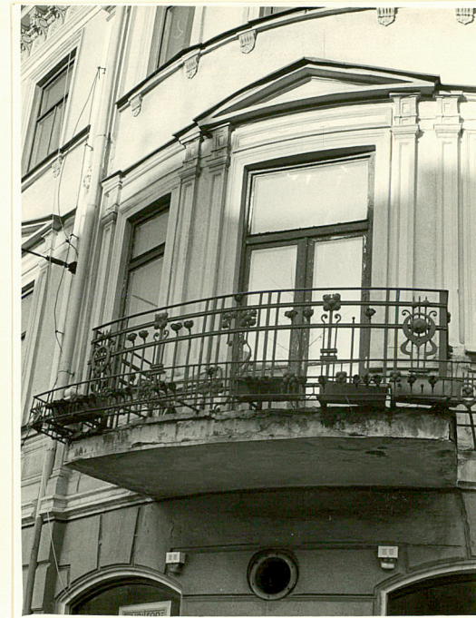
balkon w pd.-wsch.narożniku

Wkładkę założył: mgr.Ewa Bortkiewicz X 1992 (imię, nazwisko, data)