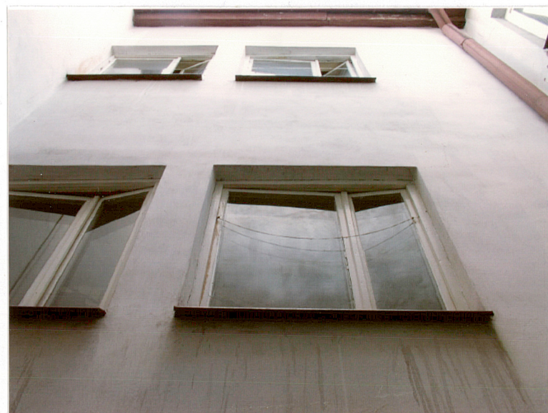
ELEWACJA W PODWÓRZU