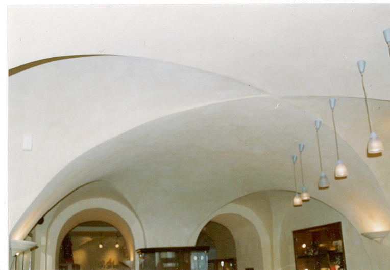
POMIESZCZENIE PARTERU W TRAKCIE FRONTOWYM