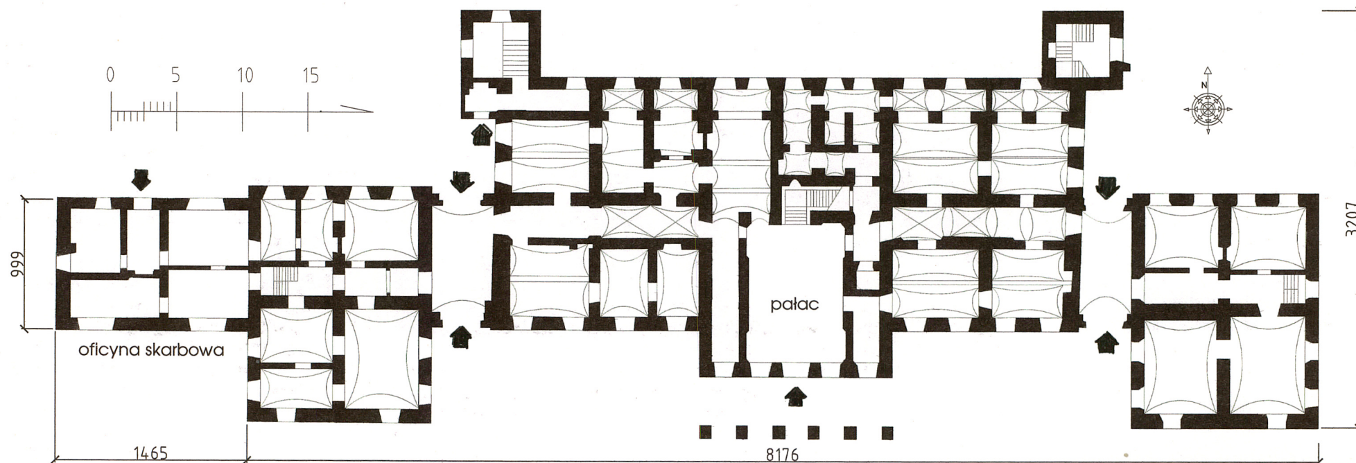
RZUT PRZYZIEMIA skala 1:400

Wkładkę założył: ..... Jadwiga Czerepińska 06.2004 ..... (imię, nazwisko, data)