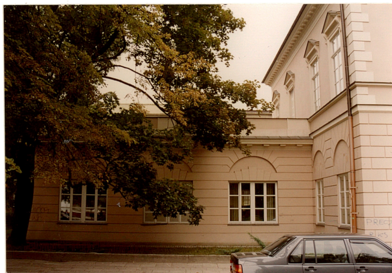
Elewacja zachodnia i widok oficyny skarbowej.