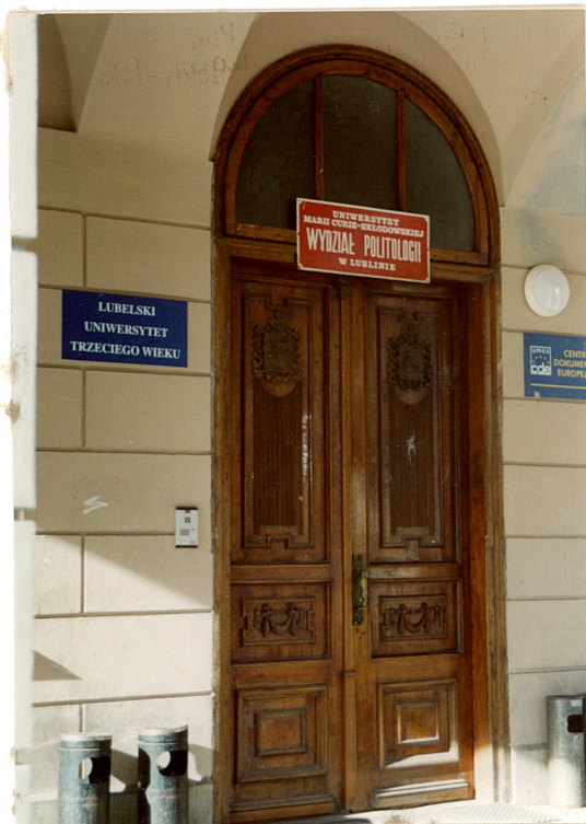
Wejście główne spod portyku.

5. Zawartość wkładki (nazwa materiału uzupełniającego) fot.