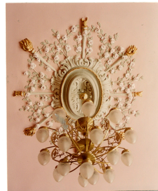
Rozeta sztukateryjna na suficie w Sali Malinowej.

Wkładkę założył: Jadwiga Teodorowicz-Gzerepińska, 08.2004 (imię, nazwisko, data)