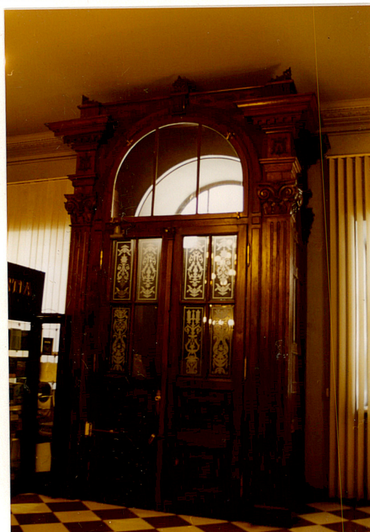
Wiatrołap w wejściu na parterze.