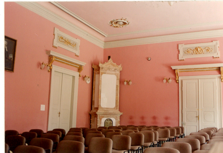
Wnętrze Sali Malinowej na I p.