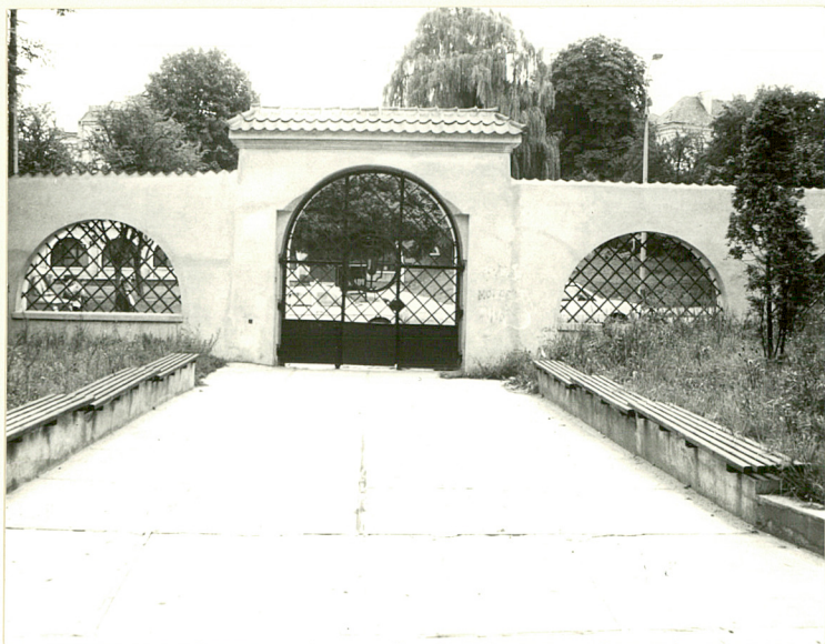
Widok od strony dziedzińca klasztornego

- Zespół karmelitów przy ulicy Hanki Sawickiej 14, Miejski Konserwator Zabytków Łublin, sygn. 259 I.