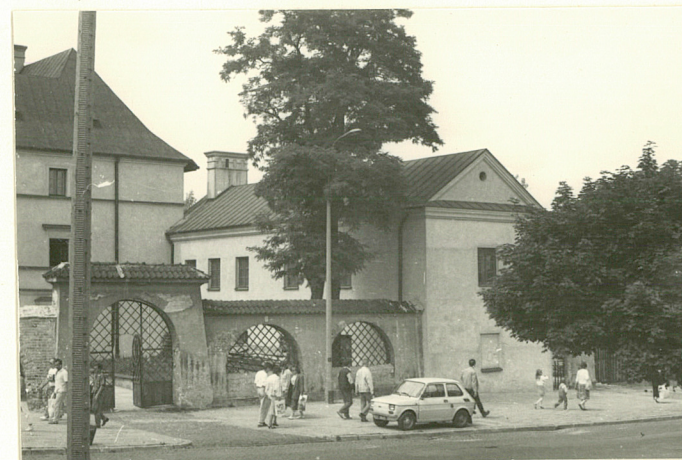
Widok od strony ulicy - - stan bezpośrednio przed remontem

Wkładkę założył: Agnieszka Madej, 20.09.1991 r. (imię, nazwisko, data)