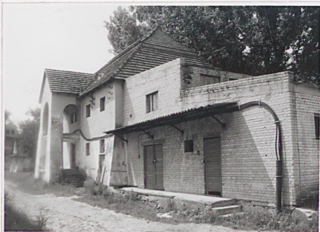
Widok od płn. wsch.