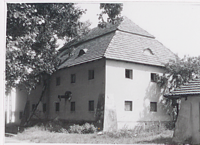
Widok od pd. zach.

Wkładkę założył: ..... (imię, nazwisko, data) J. Studziński 08.2000 SOZ LUBLIN