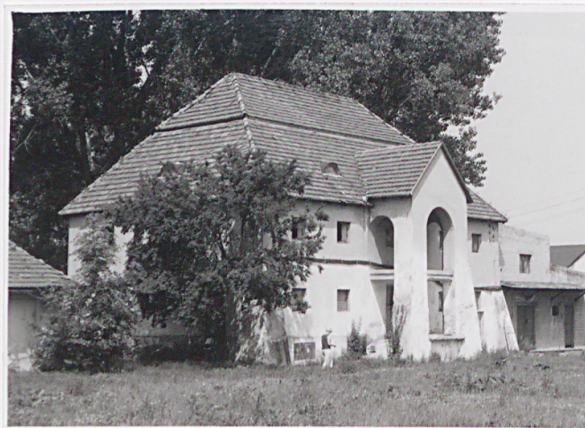
Widok od pd. wsch.