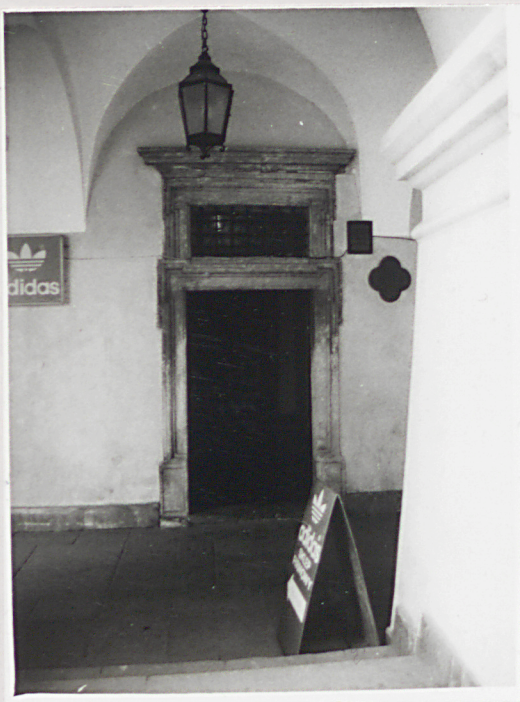
Fot.1 Portal w elewacji frontowej.