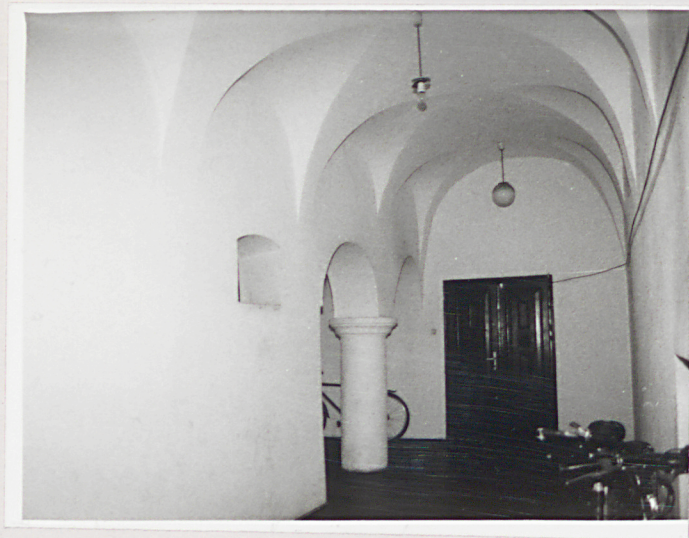
Fot. 4 Sien na Ip.