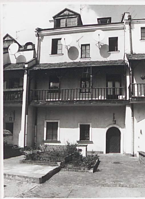
Fot. 2 Elewacja tylna.