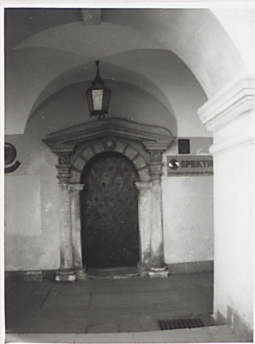
Fot.2 Portal w elewacji frontowej..