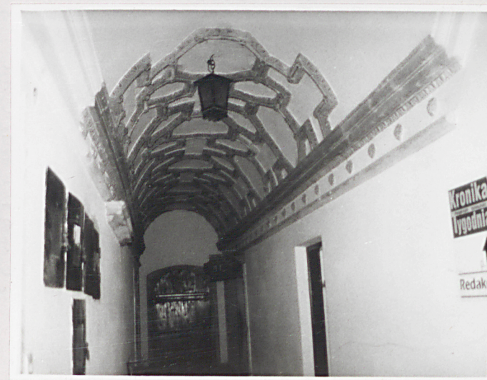
Fot.4 Sien- widok na pn.