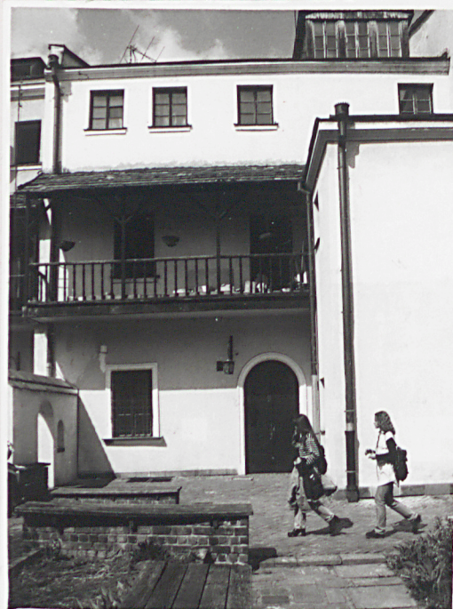
Fot.5 Elewacja pd.