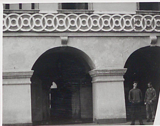
Fot.3 Fragment elewacji frontowej.