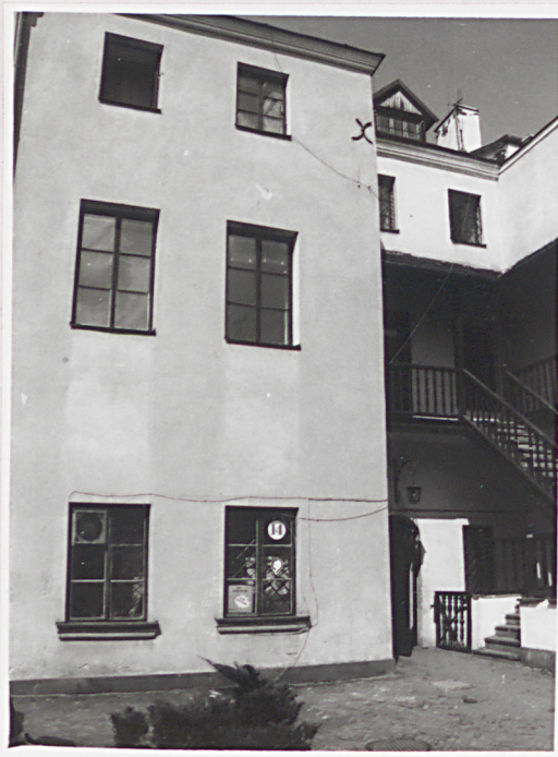
Fot.1 Elewacja tylna.