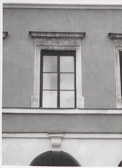
Fot.2 Okno elewacji frontowej.