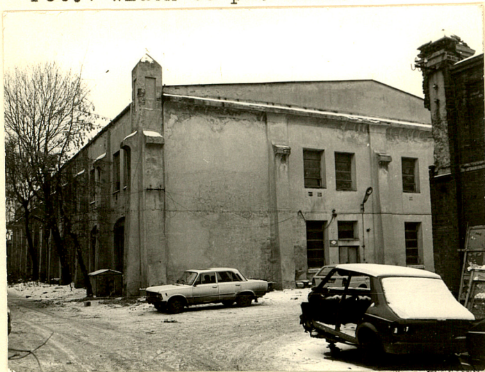
Fot.1 Widok od pn.-zach.