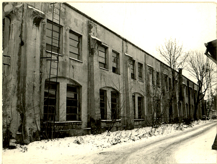
Fot.3 Widok na elewację pn.