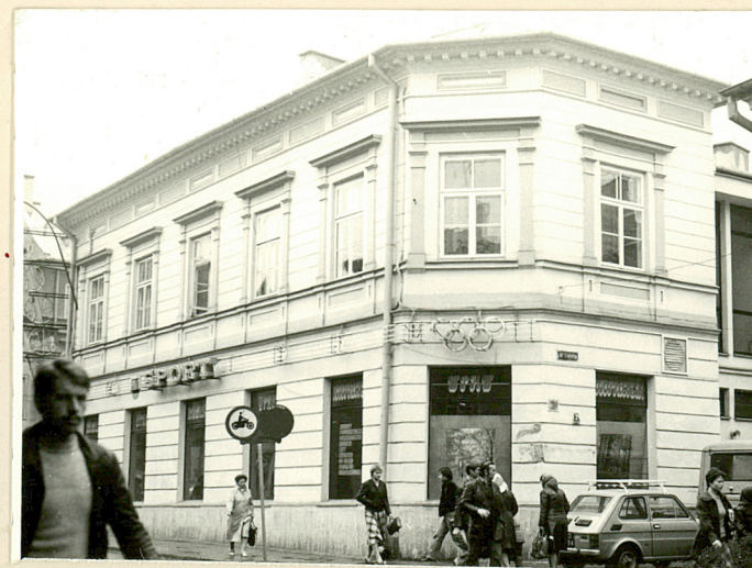
foto domu Kral. Durdin. 5

obecny stan zachowania budynku oraz charakter jego architektury, nie wymaga interwencji konserwatorskiej.