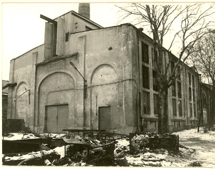
Fot.3 Widok od strony wsch. w kierunku kotłowni