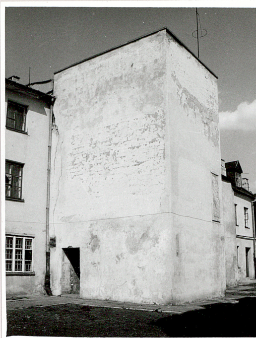
elewacja tylna widok od pd.-zach.