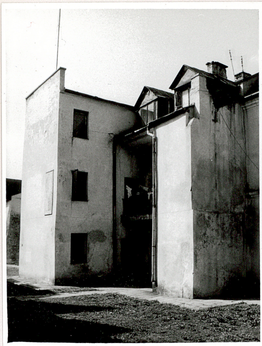
elewacja tylna-widok od pd.-wsch.