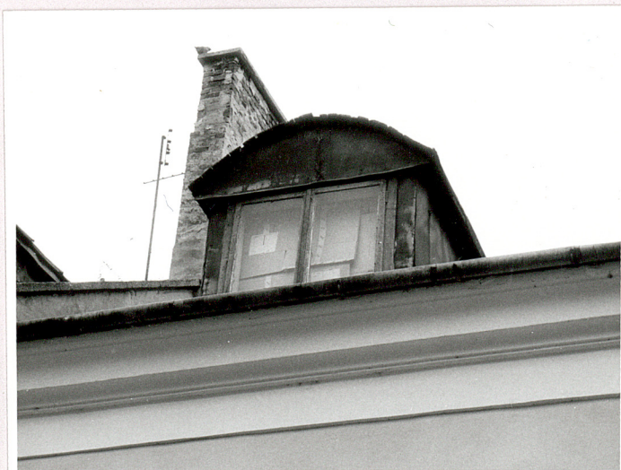
mansardowe okno elewacji front.