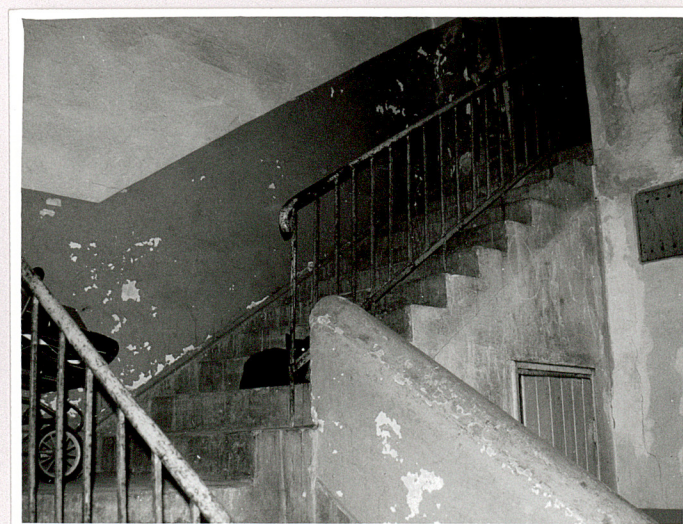
klatka schodowa w tylnym aneksie