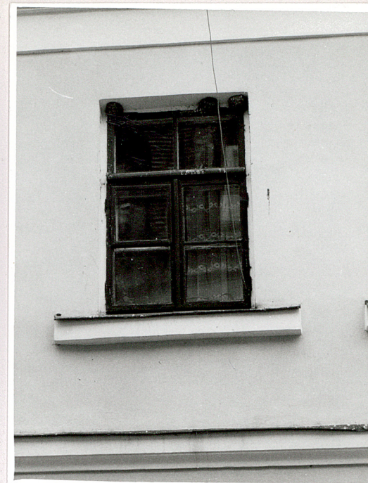
okno elewacji frontowej