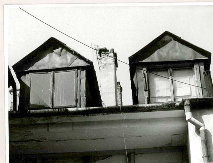
mansardowe okno elewacji tylnej

Instalacje : Elektryczna, gazowa, wod.-kan., telefon.