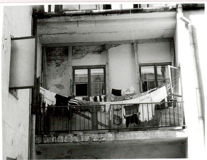
galeria w elewacji tylnej