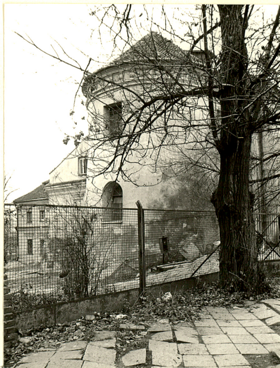
3. Naroże półn.-wsch. zespołu