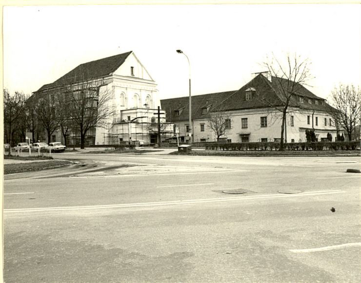
1. Widok od północy

3. Zawartość wkładki (nazwa obiektu lub materiału uzupełniającego)