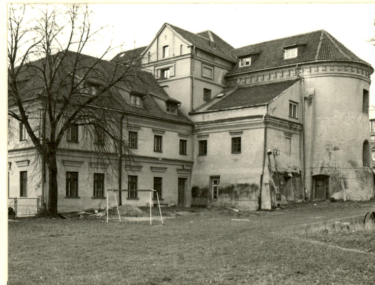
4. Naroże połud.-wsch. Zespołu

Wkładkę założył: I. Sygowska 1992 (imię, nazwisko, data)