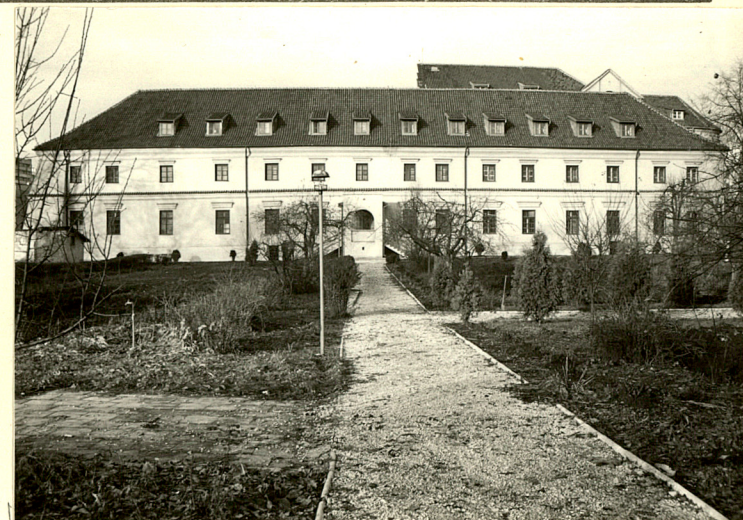
2. Widok od południa