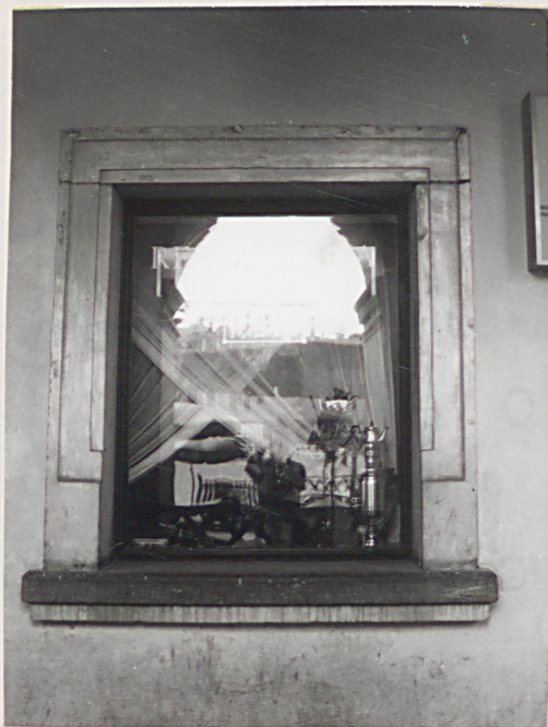
otwór okienny w elew. front.