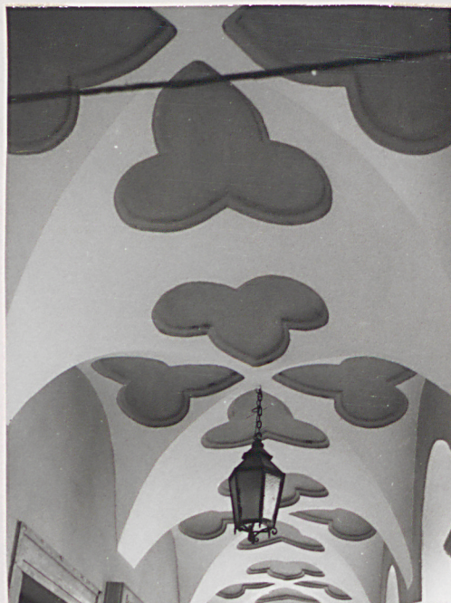
sklepienie w podcieniu