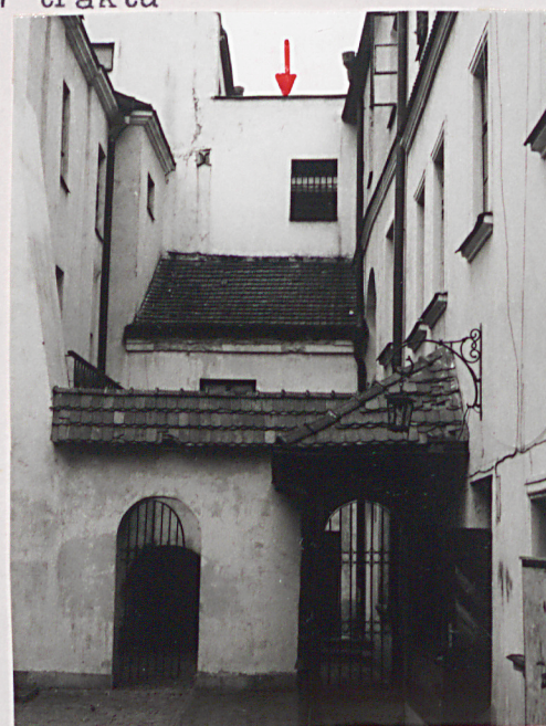
ściana boczna podwórza łącząca Staszica 23 z Żeromskiego 22