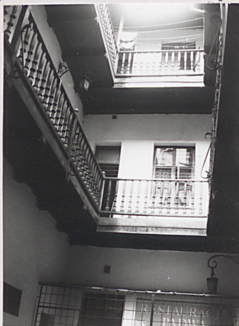
widok na elew. tylną od strony podwórza z gankami