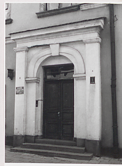
portal w elew. bocznej

Wkładkę założył: ..... Małgorzata Kowalczyk, X 1997 (imię, nazwisko, data)