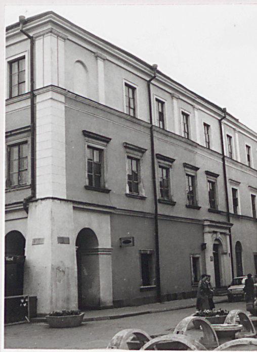
elewacja boczna od ul. Moranda