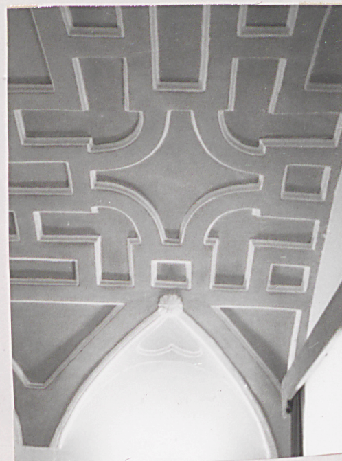
sklepienie w pomieszczeniu 1 traktu