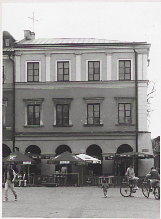
elewacja frontowa od ul. Staszica