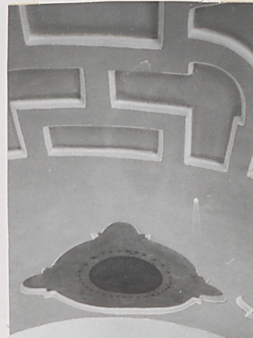
fragm. sklepienia z ro- zetą w pomieszczeniu 1 traktu