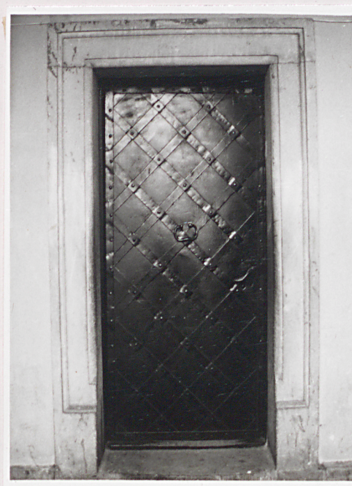
portal w elew. front.