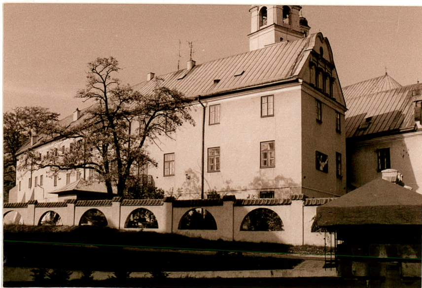
SKRZYDŁO PD. OGRÓDZENIE OD PD.