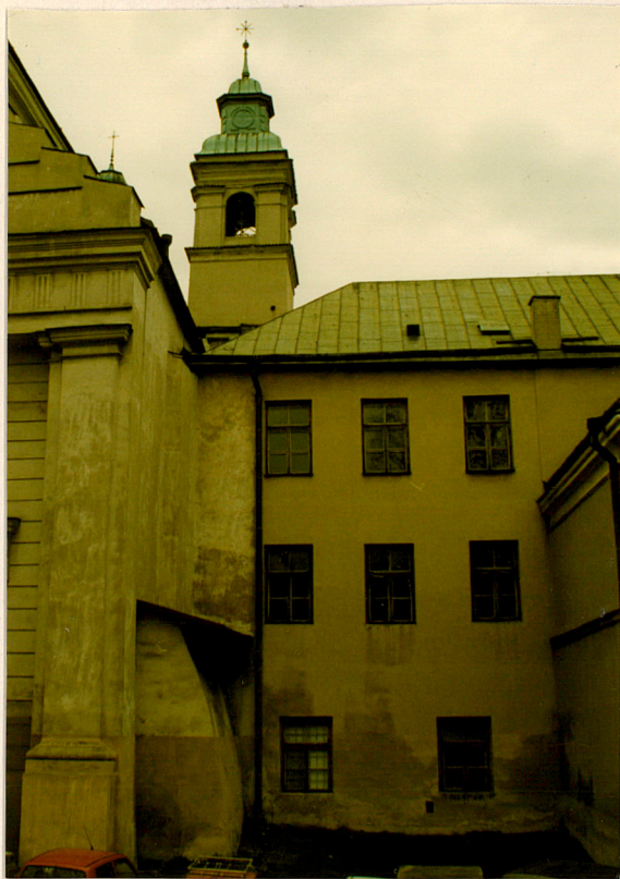
WIDOK OD ZACH.