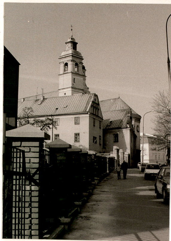
KAPLICA. FURTKA NA D. CHENTARZ. WIDOK Z UL. BERNARDYŃSKIEJ