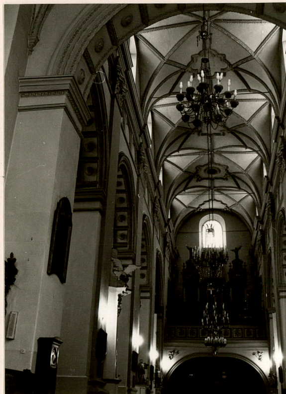
WNETRZE NAWY GŁÓWNEJ