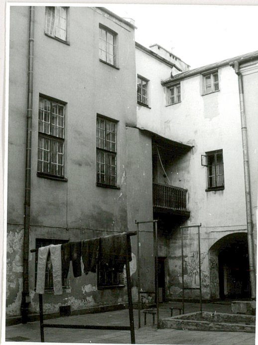
Widok od podwórza