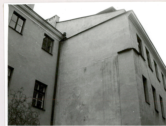
widok na narożnik pomiędzy pn. elewacją bocznią i tylną