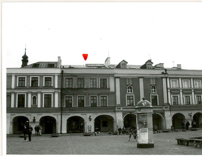
widok na kamienicę w zabudowie zwartej Rynku Wielkiego

Instalacje. Wod.-kan., c.o., gaz., elektr., teletech.