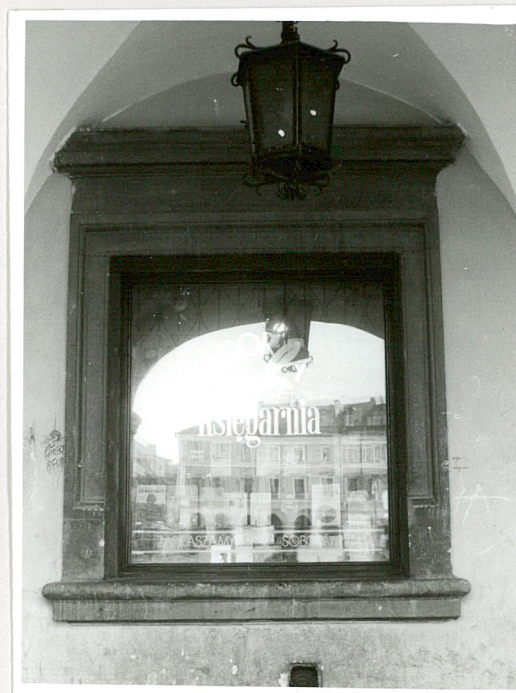
otwór okienny w 1 kond. elewacji frontowej (na lewo od portalu)