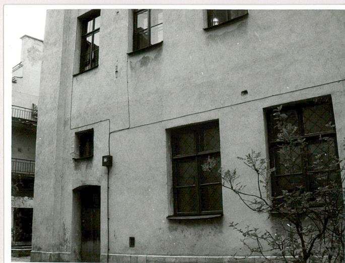
fragm. elewacji tylnej (1 i 2 kondygnacja)