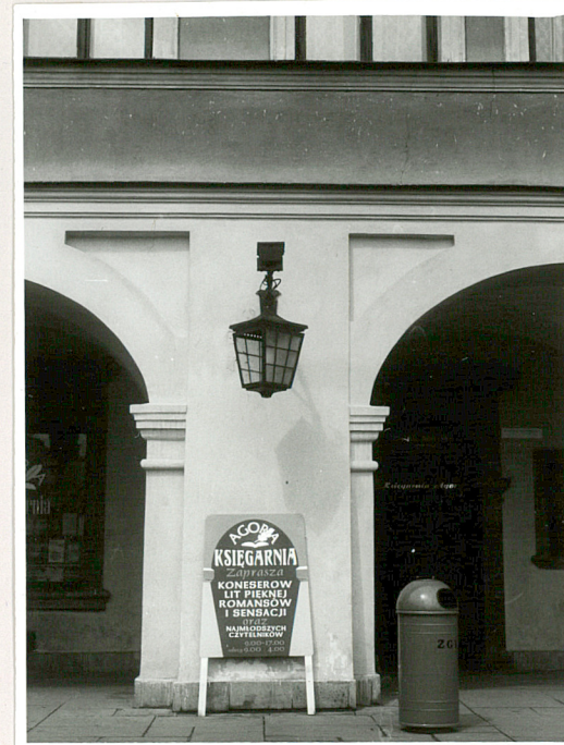
fragm. elew. frontowej- widok na filar podpierający arkadę

Wkładkę założył: Małgorzata Kowalczyk, 1997 (imię, nazwisko, data)