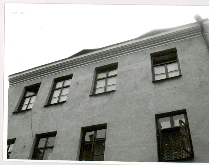
fragm. elewacji tylnej (2 i 3 kondygnacja)