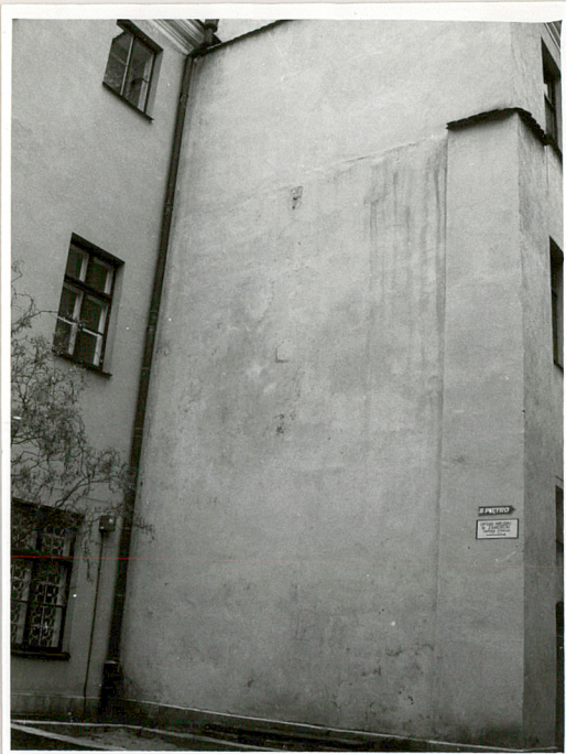
elewacja boczna (pn.)