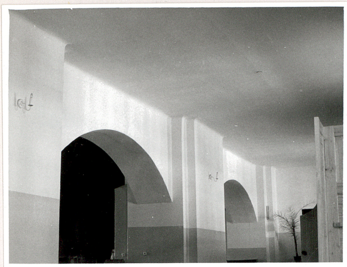
nawa boczna pn. - widok na arkadę