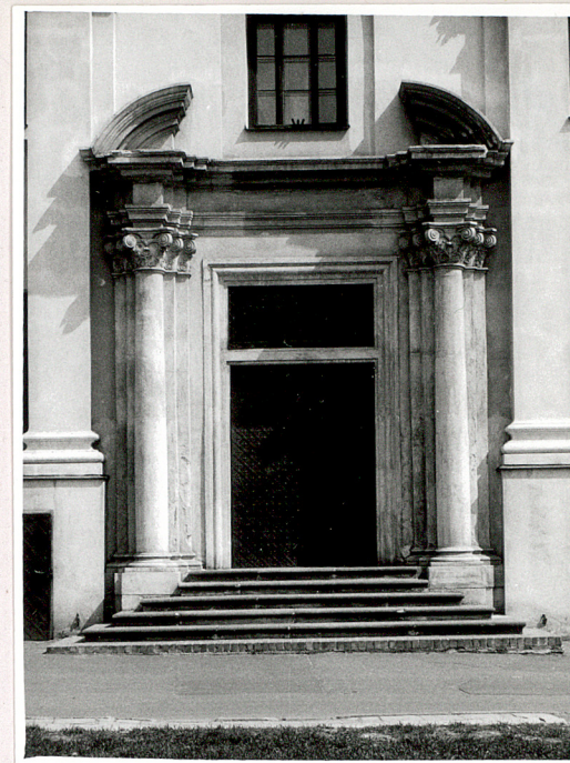
portal w elew. zach.