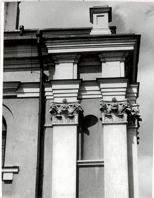
fragment elew. pd.