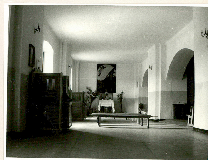
nawa boczna - pd.