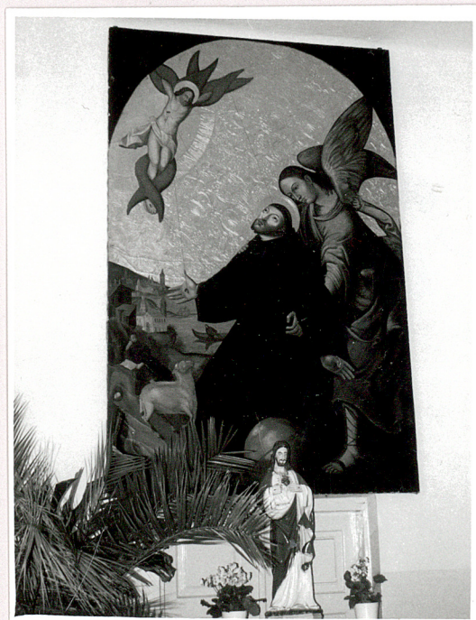
ołtarz w nawie bocznej (pd.)