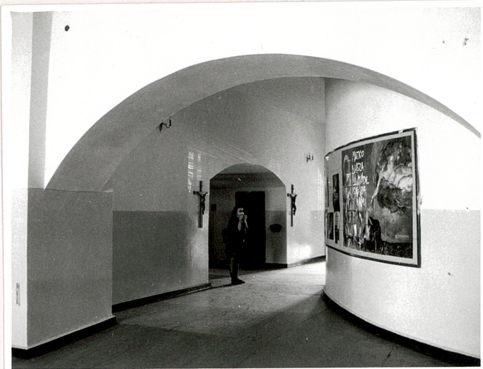
obejście za dawnym prezbiterium