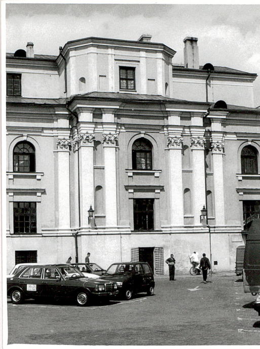
pd. ramię transeptu