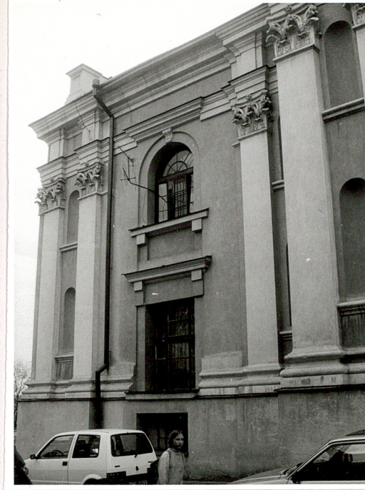
fragment elew. pn.