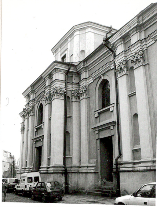
pn. ramię transeptu