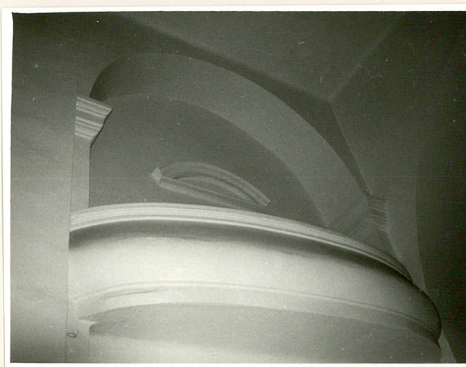
jedna z loży - empor