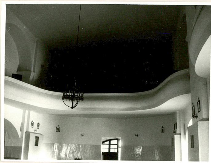
nawa gł. - widok na chór muzyczny (dawny balkon)