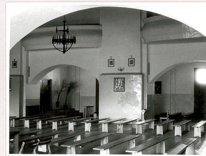
nawa główna-widok na arkadę