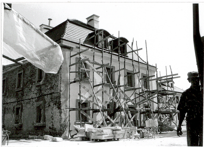
1. Widok od pd. zach.