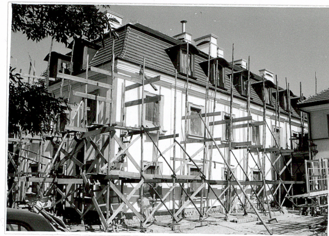
3. Elewacja wsch. – widok od pd. wsch.