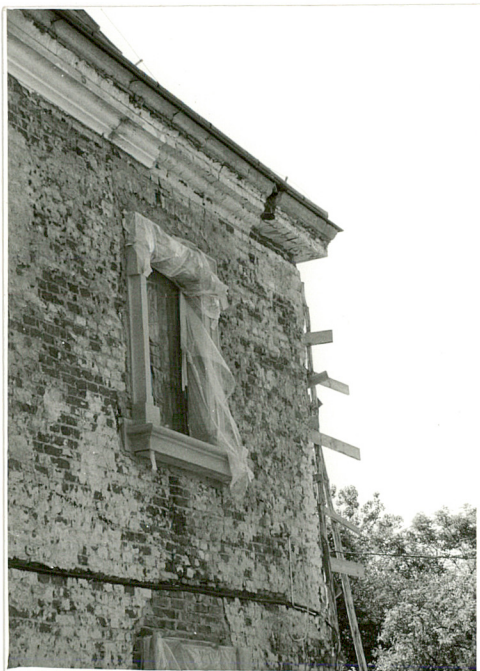
1. Elewacja zach.