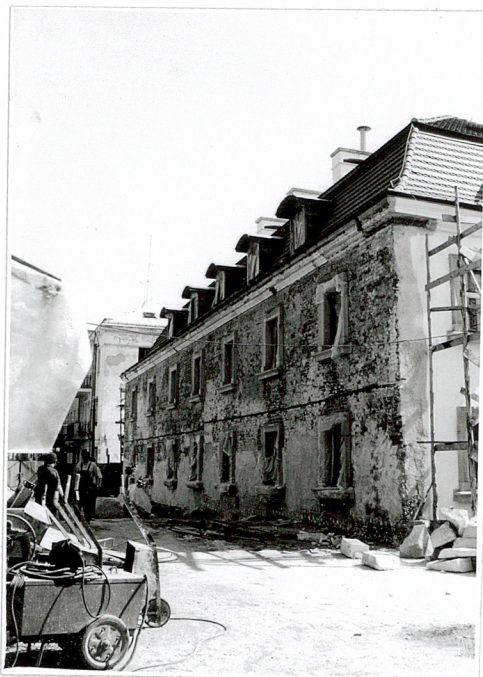
2. Elewacja zach. – widok od pd. zach.