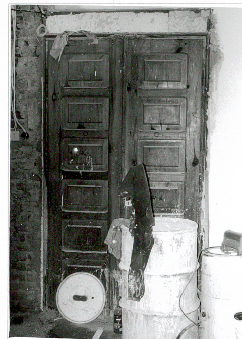
3. Wnętrze – stolarka sprzed remontu.