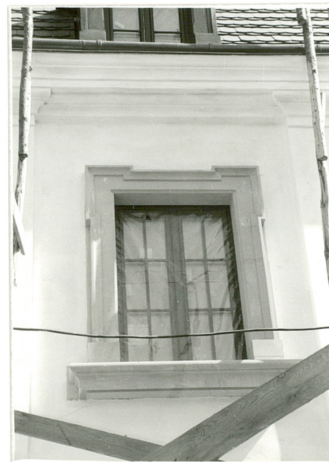
2. Elewacja pd. – stan po restauracji.

Wkładkę założył: . . . . . Mgr Grażyna Michalska 30.11.1998r. . . . . . (imię, nazwisko, data)