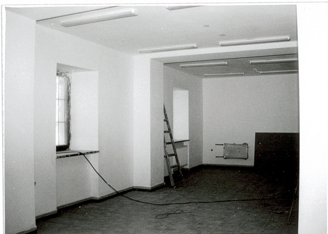
4. Wnętrze – pomieszczenie parteru w trakcie wsch.