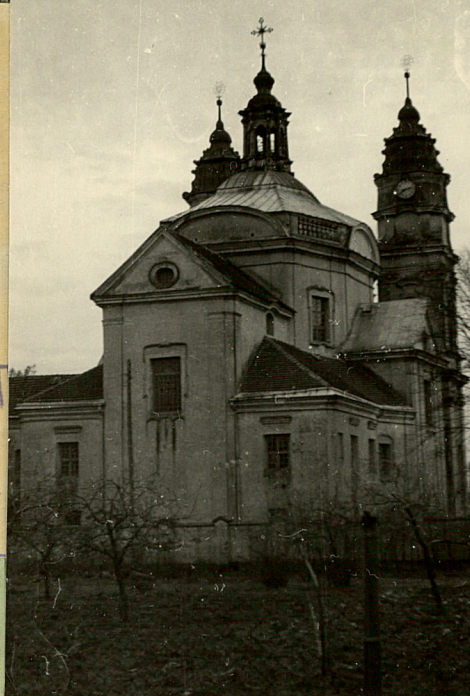
22. Działanie... konserwatorski...