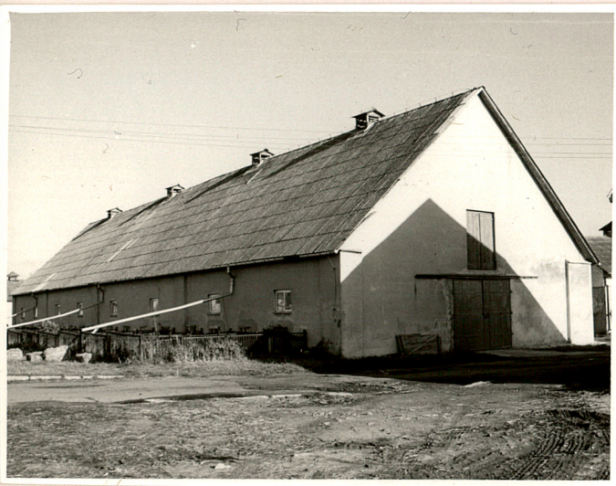
widok od zach.