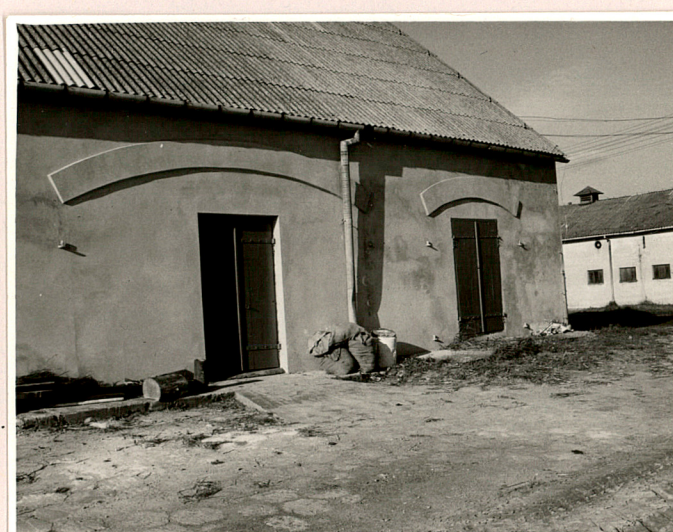
fragment elewacji wsch.