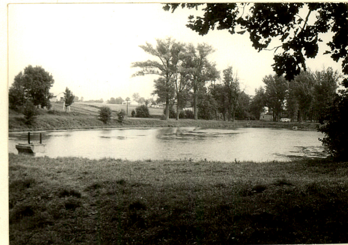
fot.6 Staw wsch. na wysokości dworu, widok z grobli.