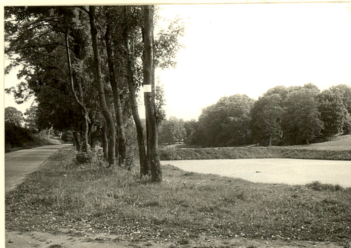
fot.3 Pn. granica zespołu - droga do Sporniaka i stawy