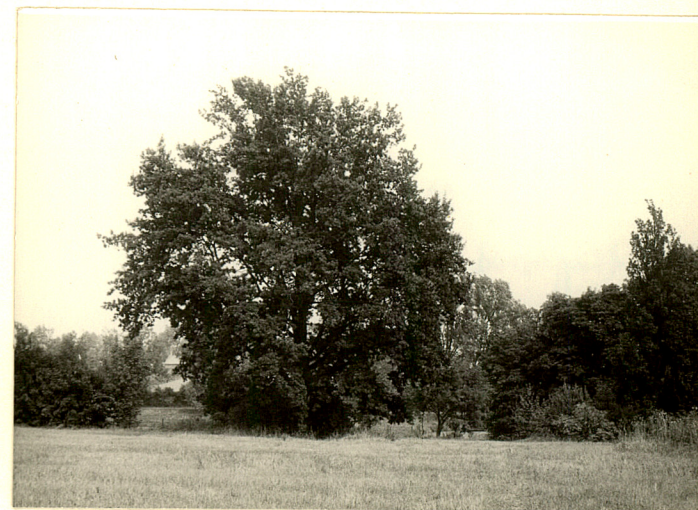
fot.18 Wnętrze parkowe w cz. zach., widoczny dąb bez- szypułkowy