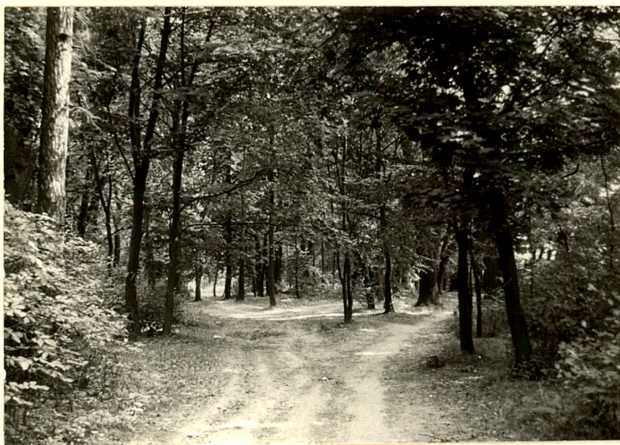
fot.16 Ciągi komunikacyjne w środk. części parku