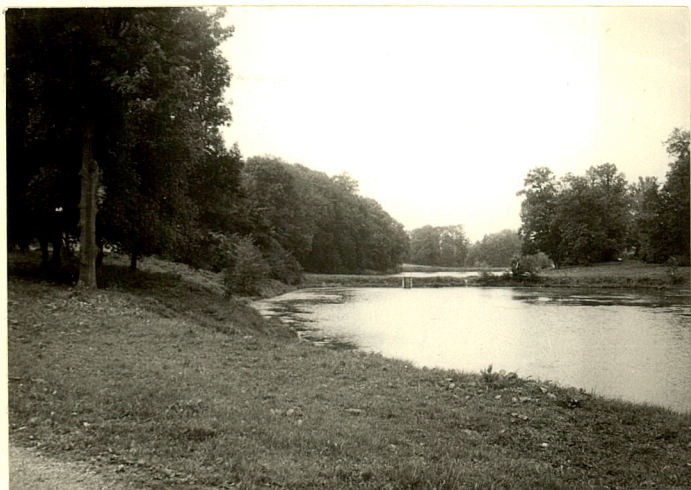
fot.4 Widok na stawy od wsch. w kier. zach.