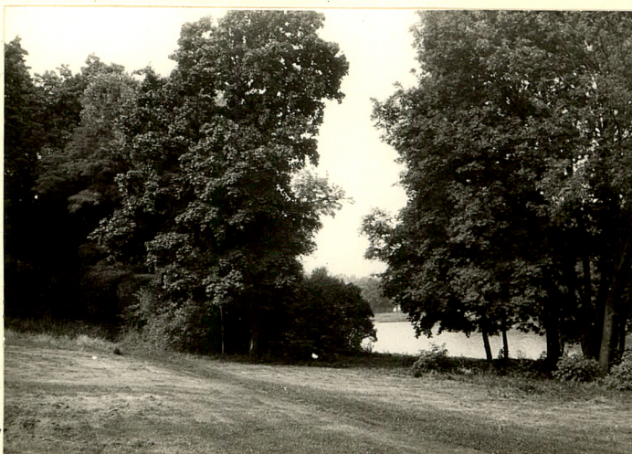
fot.7 widok od dworu w kier. zach. w str. stawów