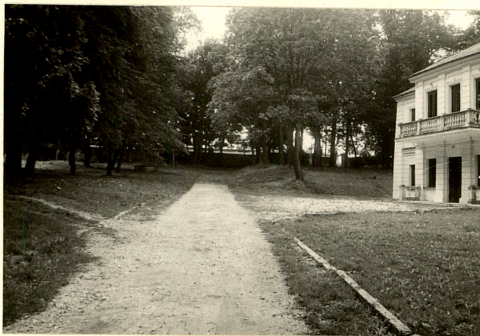
fot.10 Aleja i podjazd przed dworem