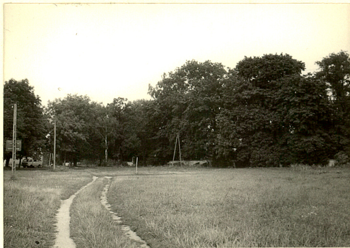
fot.13 Widok ogólny parku od str. folwarku /płd./