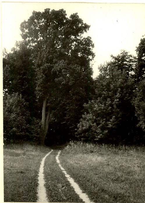
fot.17 Droga od dworu w str. parku