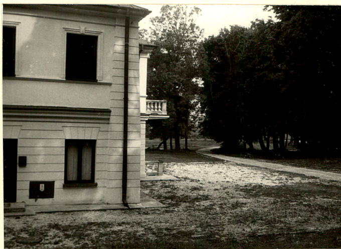
Fot.11 Podjazd przed dworem