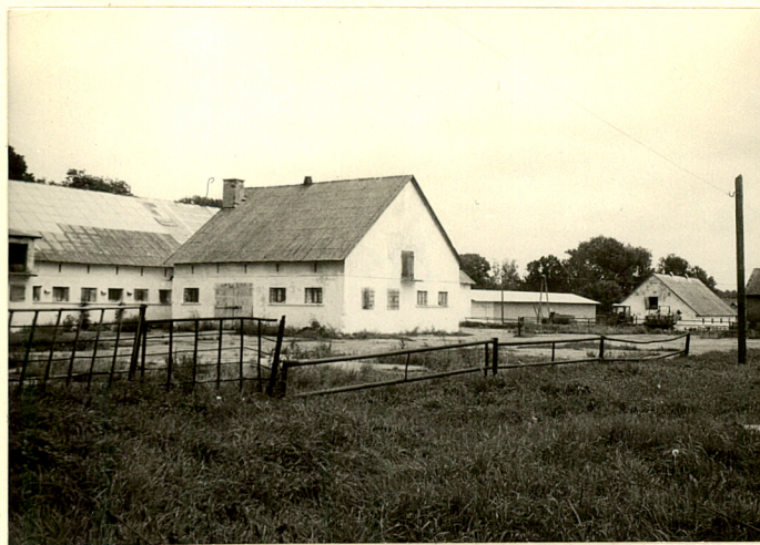
fot.14 Zabudowania w środkowej cz. d.folwarku