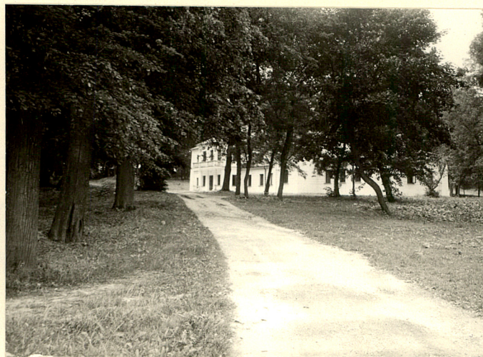
fot.8 Główny wjazd do dworu