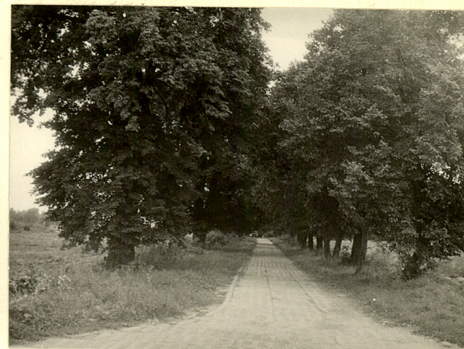
fot.15 Aleja lipowa w części pd.-zach. zespołu