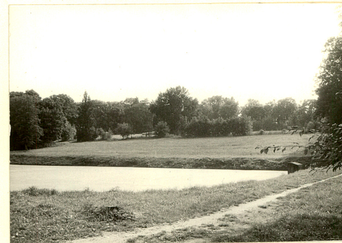
fot.1 Widok ogólny od str. pn.-zach.

Wkładkę założył: W. Boruch, IX.94 (imię, nazwisko, data)