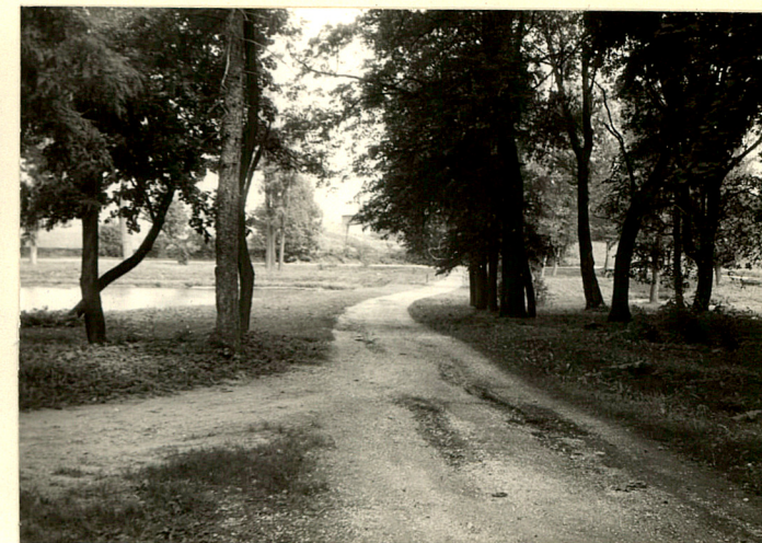
fot.9 Aleja do dworu, widok od dworu w str. pn.