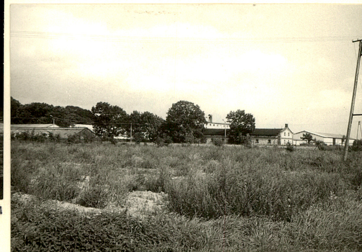
fot.12 Widok ogólny od pd. na d. folwark gospodarczy Wzór ODZ 1978 r.

Wkładkę założył: W. Boruch. IX.94 (imię, nazwisko, data)