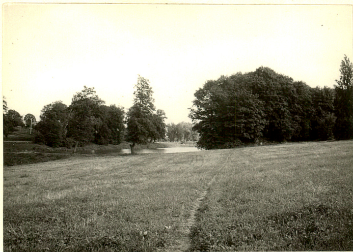
fot.2 Widok od zach w str. stawów i dworu