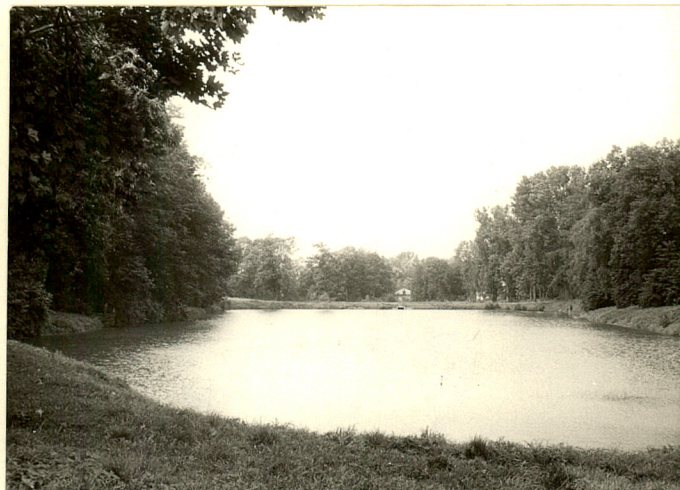
fot.5 Staw środkowy, widok z grobli w kier. zach.