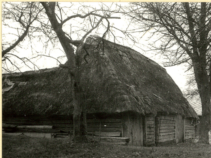
Fot.1 Widok od pn.-wsch.

Wkładkę założył: Bożena Lebioda, X.1990 r.