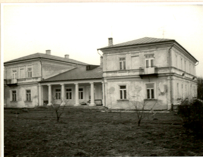
Fot. 1 Widok od pd.-zach. na elewację ogrodową.