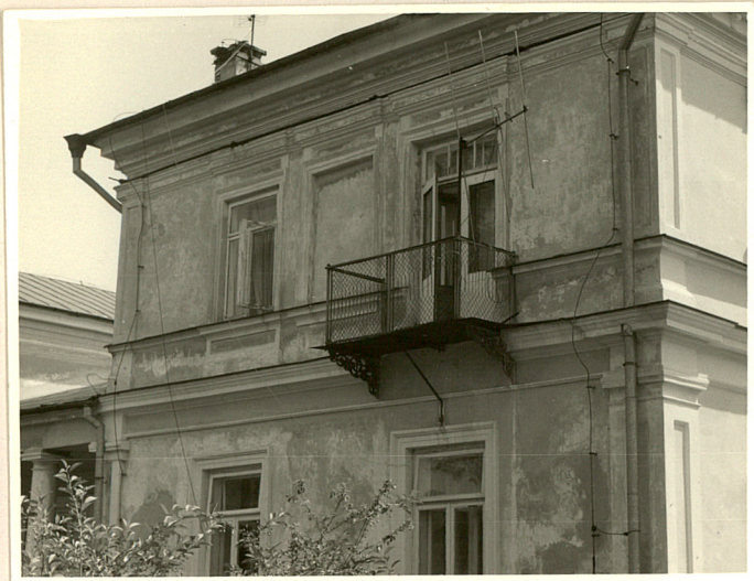
Fot. 4 Fragment elewacji ogrodowej.