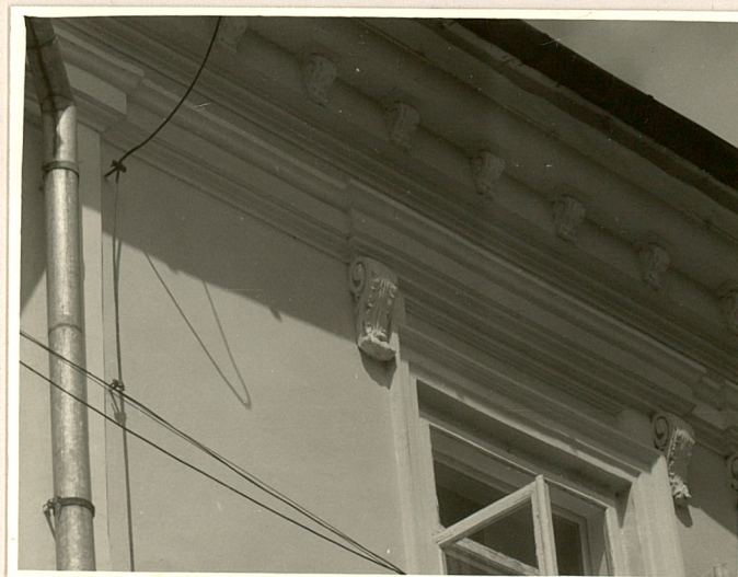
Fot. 7 Zwieńczenie elewacji frontowej.