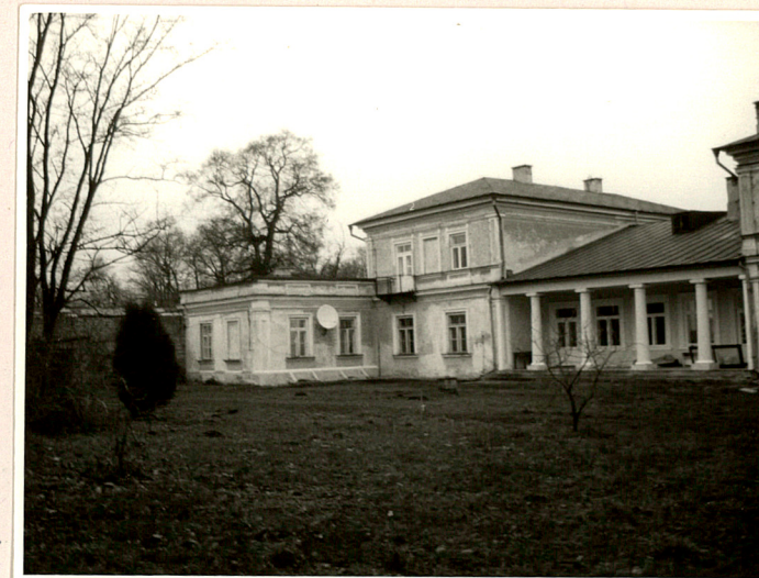
Fot. 2 Część pn. elewacji ogrodowej.