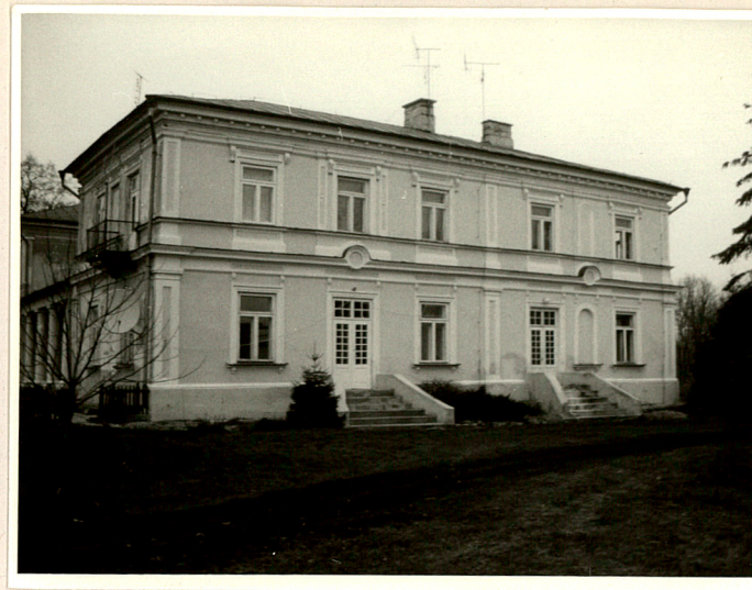
Fot. 5 Elewacja pd.