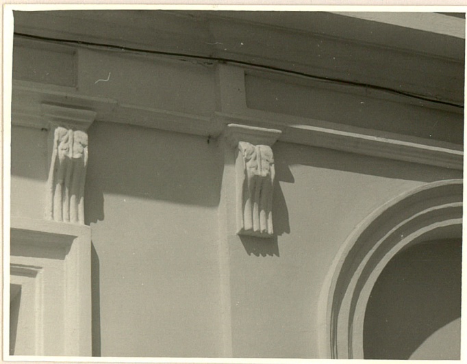
Fot. 6 Fragment dekoracji architektonicznej w elewacji frontowej.